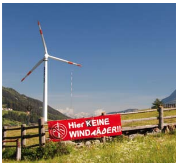
Abb. 42: Auf der Malser Haide werden nach eigenen Aussagen der Betreiber die Windräder wieder abgebaut. Am Brenner (oder auch anderswo) sollten erst gar keine mehr errichtet werden!

Wir sollten nicht mit dem Zeigefinger auf die italienischen Jäger zeigen, die Singvögel und andere zu Tausenden in Netzen fangen und auf ihren Zugwegen abschießen, wenn wir in Südtirol nicht willens oder in der Lage sind, den Tod von Tausenden Zugvögeln zu verhindern. Und dies alles, obwohl wir Strom schon jetzt über den Eigenbedarf hinaus produzieren und sogar exportieren.