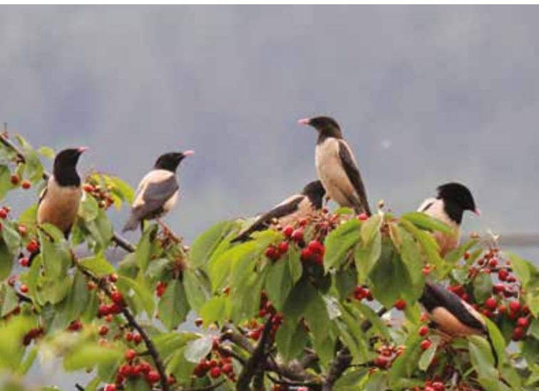
Rosenstare in Agums/Prad am Stilfser Joch. Sie fressen bevorzugt Heuschrecken, aber Kirschen schmecken ihnen wohl auch.