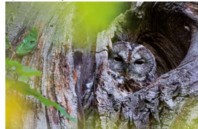
Ein naturnaher Wald mit alten Bäumen hat meistens ein ausreichend gutes Höhlenangebot für Käuze. (J. Wassermann)