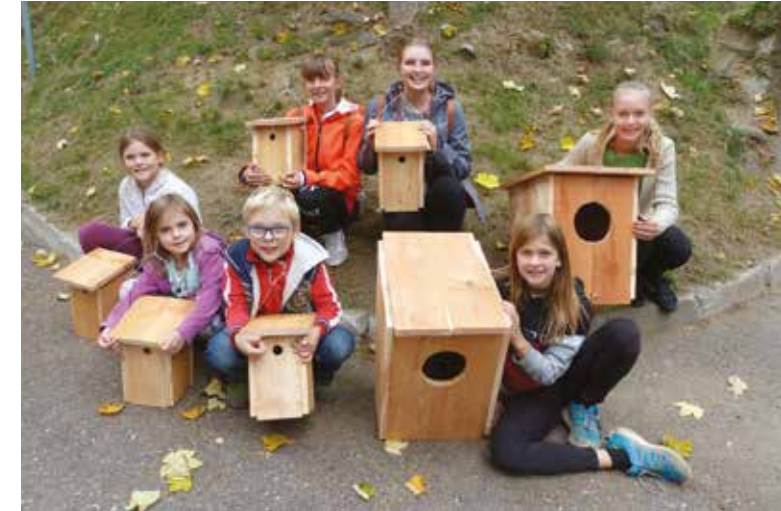
Die Kinder zeigen stolz ihre selbst gebastelten Nistkästen.

Höhlenbrüter brauchen Nisthöhlen in alten Bäumen, manchmal auch in Trockenmauern. Die natürlichen Baumeister für Schlaf-, Wohn- und Bruthöhlen sind unsere Spechte. Fehlen solche Höhlen, so ist dies ein limitierender Faktor für den Bestand aller Höhlenbrüter; um geeignete Bruthöhlen wird kräftig gestritten. Vorrangiges Ziel muss deshalb immer sein, mehr natürliche Nistmöglichkeiten zu erhalten. Als zusätzliches Angebot kann man dann mit künstlichen Nisthilfen nachhelfen. Wir wünschen, dass in allen Nistkästen im Frühjahr Vogelfamilien einziehen und den Kindern unvergessliche Beobachtungsmöglichkeiten bieten.