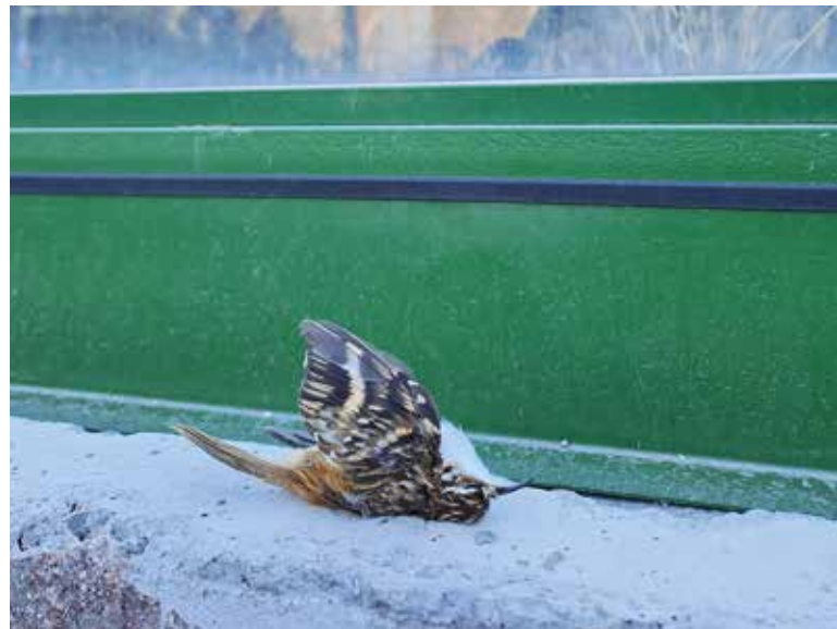
Der Vogelschlag ist ein großes Problem bei Lärmschutzwänden und anderen Glasscheiben.