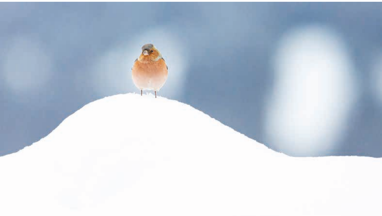
Der farbenprächtige Buchfink belegte Rang 3.