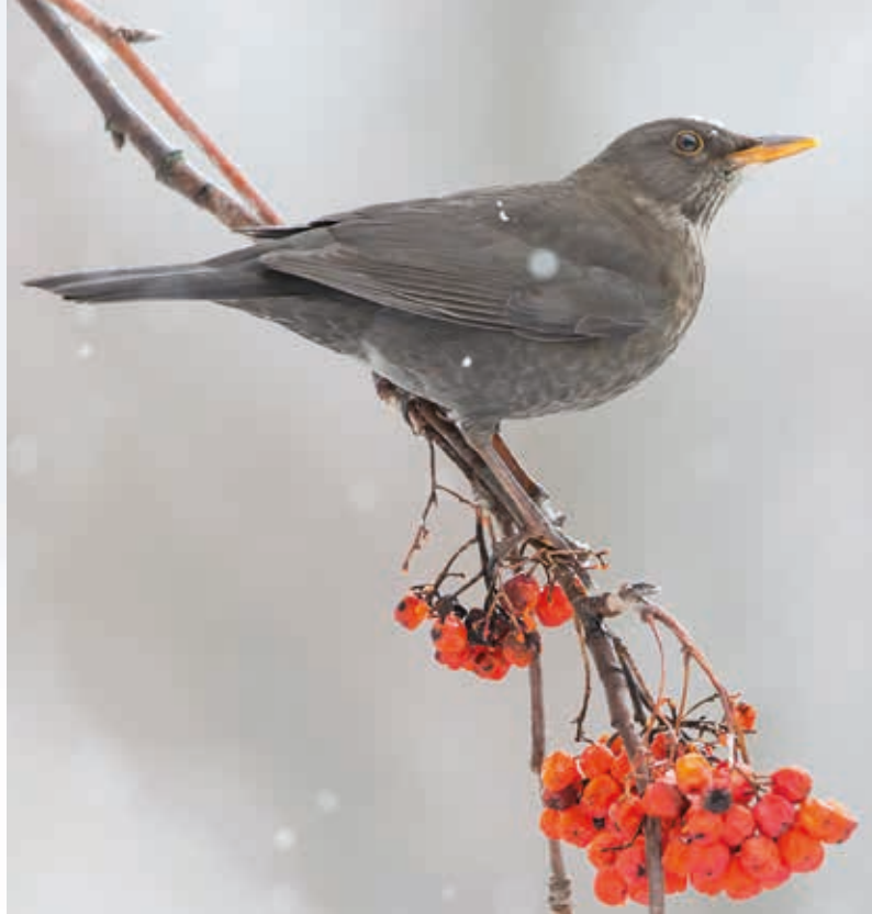
Links im Bild: die Wacholderdrossel überwintert in Südtirol. Auf dem rechten Foto: ein Amselweibchen.