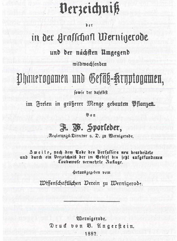
Abb. 1. Titelblatt der 2. Auflage der Flora SPORLEDER'S.

Die 2. Auflage enthält an Phanerogamen und Gefäßkryptogamen 1115 nummerierte Arten. Hinzu kommen noch 160 Sippen von Kulturpflanzen, die ohne Nummer aufgeführt sind. Bei manchen Nummern wurde noch eine Untergliederung vorgenommen. Zum einen handelt sich dabei um Unterarten bzw. Varietäten, die heute als eigene Arten geführt werden. Es findet sich z. B. bei SPORLEDER unter derselben Nummer „ Alisma Plantago “ und die „Abänderung lanceolatum “, die heute