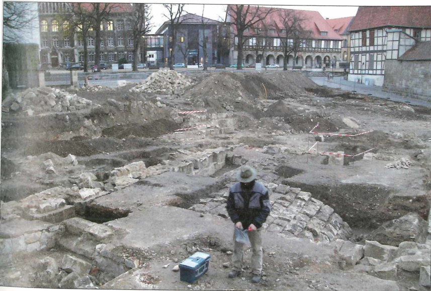
Das Grundstück Domplatz 37 wurde nach dem Abriss des früheren Heineanum-Gebäudes zwischenzeitlich zu einer archäologischen Grabungsfläche. In dem erst teilweise freigelegten mittelalterlichen Tonnengewölbe befand sich ein in den 1970er Jahren rustikal ausgebauter Raum, der bis Ende der 1980er Jahre für gemütliche Veranstaltungen und Diskussionsrunden nach Besuchen der Ausstellung ("Brigadeveranstaltungen") genutzt wurde.

Die Neueingänge in die Sammlung sind in den letzten Jahren etwas zurückgegangen; das vor allem, weil weniger Zufallsfunde eingeliefert werden. Allerdings ist das natürlich auch der Stellenreduzierung geschuldet, da zwangsläufig nicht mehr so viel präpariert werden kann. Als nennenswerte Zugänge in der letzten Dekade seien hier noch angefügt: 1999/2000: 212 Eier von 59 Arten aus der Fasanerie Möller/