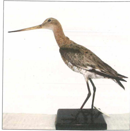
Präparat einer Uferschnepfe Limosa limosa aus der Sammlung von G. v. NATHUSIUS, das bereits in den 1970er Jahren ins Heineanum gekommen ist. Seit 2005 sind nun sämtliche Präparate der NATHUSIUS-Sammlung in Halberstadt durch Schenkungsvertrag in das Eigentum des Museums übergegangen.

Inzwischen hat sich die Lage im Verwaltungs- und Werkstattbereich des Heineanums wieder normalisiert und die Mitarbeiter haben sich an die neuen Räumlichkeiten gewöhnt. Die ehemalige, zum Domplatz 37 gehörende Gebäudehälfte wurde der Stadt Halberstadt rückübertragen. Sie zählt jetzt zum alten Museumskomplex Domplatz 36, von wo aus es ohnehin nur noch den einzigen Zugang gibt. Auch der östliche Teil dieses Gebäudes, in dem sich zwischenzeitlich – etwa von Anfang der 1980er Jahre bis 2006 – ein von mehreren Pächtern betriebenes Museumscafé befand, ist wieder umgebaut und mit Unterstützung unseres