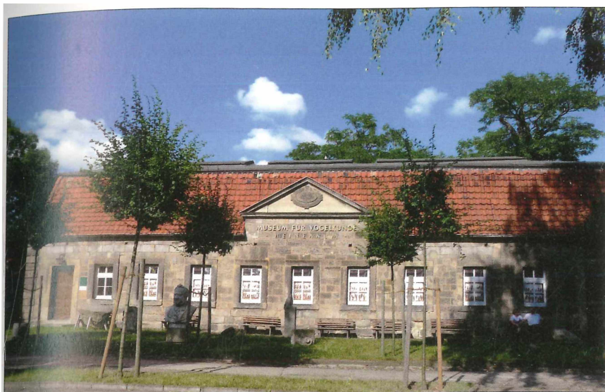
Ansicht des Ausstellungsgebäudes nach dem Verkleiden der aus Lichtschutzgründen ohnehin ständig verschlossenen Fenster mit Fototafeln.

seitige Hilfe und Unterstützung. Selbstverständlich sind Mitgliedschaften in Fachorganisationen und Vereinen, der Besuch von Tagungen. So sind das Heineanum oder seine Mitarbeiter Mitglieder im Museumsverband Sachsen-Anhalt, im Deutschen Museumsbund (DMB), im Verband Deutscher Präparatoren (VDP), in der Deutschen Ornithologen-Gesellschaft (DO-G), im Ornithologenverband Sachsen-Anhalt (OSA) und in diversen anderen ornithologischen Landes- und Regionalvereinen. Von Bedeutung sind die Tagungen, die auf Einladung des Museums Heineanum in Halberstadt stattfanden, so in erster Linie: Tagung der Landesgruppe Sachsen-Anhalt des VDP (1992 und 2005), Jahrestagung des OSA (1999, eingeladen: 2009), Tagung der Projektgruppe Spechte der DO-G (2000), Jahresversammlung der DO-G (2003), Tagung der Projektgruppe Ornithologische Sammlungen der DO-G (2004), Herbsttagung der Naturwissenschaftlichen Museen im DMB (2005). Neben der oft recht aufwändigen organisatorischen Vorbereitung solcher Tagungen wird Fachkompetenz und Unterstützung aus der Einrichtung