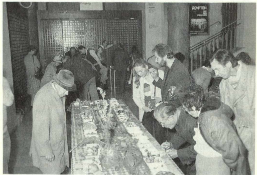
Reger Besuch bei der „Großen Pilzausstellung im Luitpoldhaus, 8./9. 10. 1983.