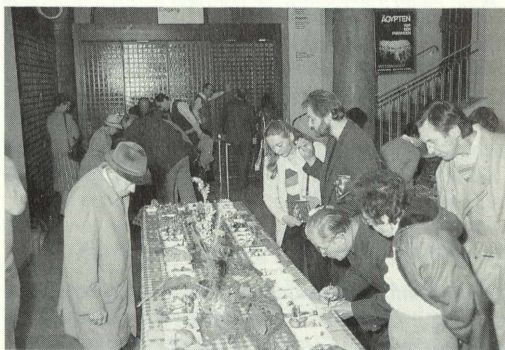
Reger Besuch bei der „Großen Pilzausstellung im Luitpoldhaus, 8./9. 10. 1983.