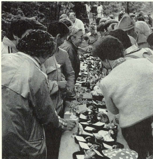
Pilzausstellung am Schmausenbuck, 12. 7. 1980

Die Ausstellungstische sind von neugierigen Besuchern dicht umlagert. Abwechselnd erteilen die Pilzberater Auskünfte und erklären die aufliegenden Frischpilze.