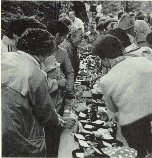
Pilzausstellung am Schmausenbuck, 12. 7. 1980

Die Ausstellungstische sind von neugierigen Besuchern dicht umlagert. Abwechselnd erteilen die Pilzberater Auskünfte und erklären die aufliegenden Frischpilze.