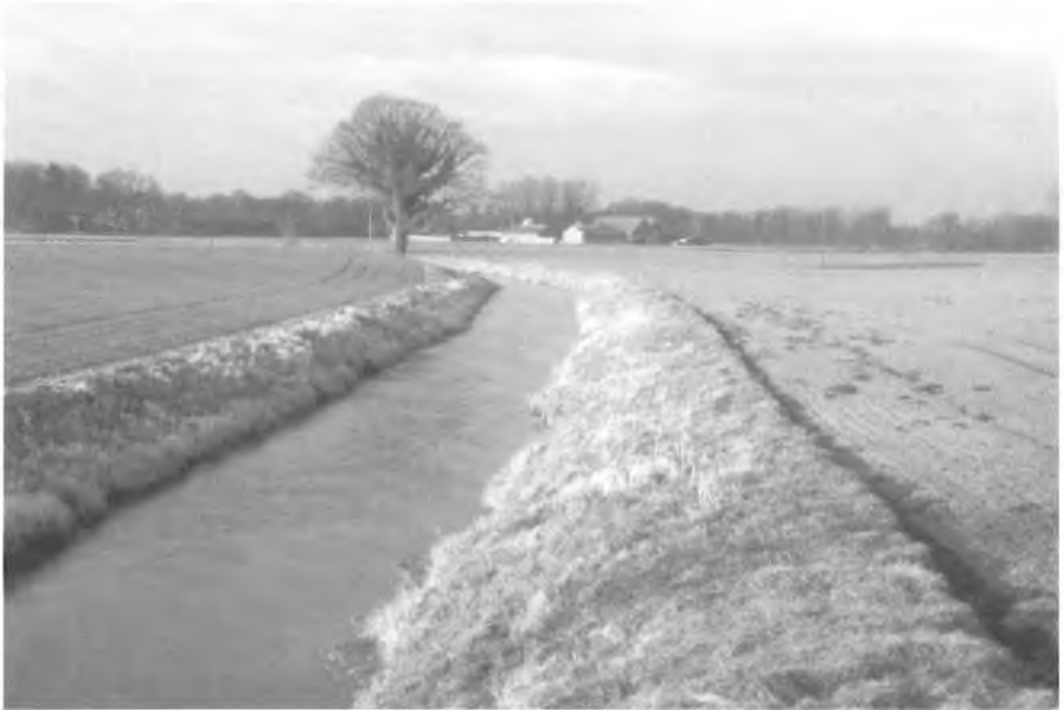
Abb. 1: Stark begradigter und ausgebauter Bachlauf am Eltingmühlenbach.

Im weiteren Flussverlauf sind das Bachbett und die Ufer des Eltingmühlenbaches bis auf wenige Ausnahmen befestigt und ausgebaut (Abb. 1). Einige Male passiert oder durchquert der Fluss kleinere Wälder oder einseitige Erlen- oder Pappel-Anpflanzungen. Die Landschaft ist durch Ackerbau, vorrangig Maisanbau, geprägt, und die Felder reichen fast an den Bachlauf heran. Eine Ausbildung von Uferröhrichten ist daher nur begrenzt und sehr kleinräumig möglich. Durch die über lange Strecken fehlende Be-