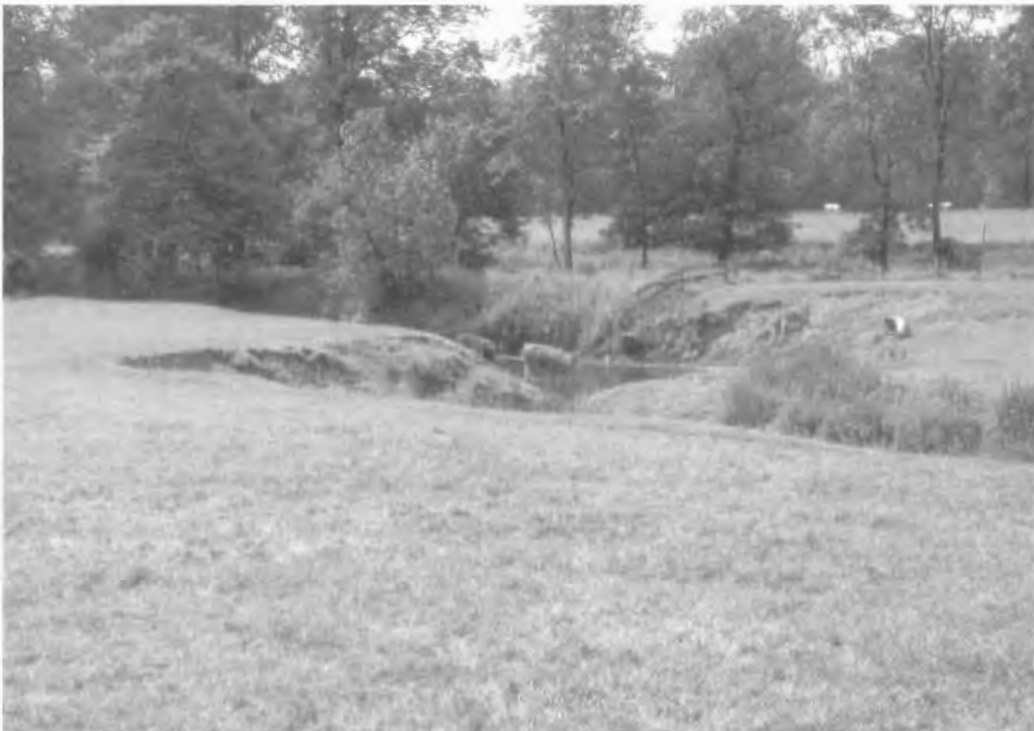
Abb. 2: Der Eltingmühlenbach bildet einen natürlichen Weidezaun für Schafe und Kühe.