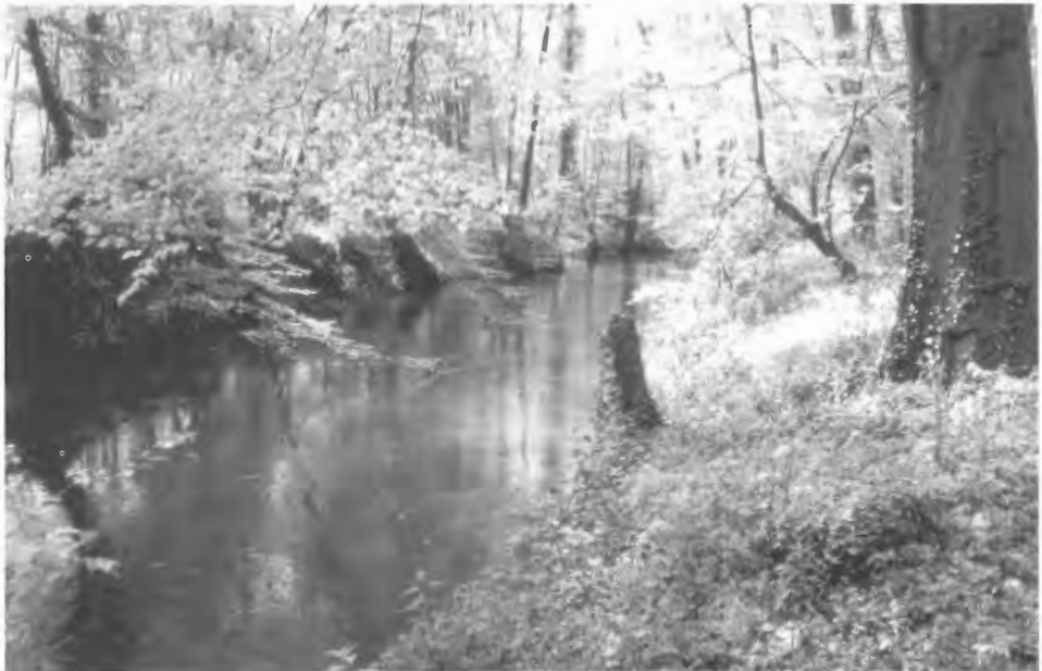
Abb. 4: Naturnaher Eltingmühlenbach mit angrenzendem Buchenwald

Obwohl es sich um verschiedenartigen und nicht angepflanzten Baumbestand handelt, entsteht der Eindruck einer sogenannten gepflanzten „Grünverrohrung“ (s. GLANDT 1993). Die Bäume sind stellenweise sehr kleinwüchsig, bei Kronenschluss entsteht der Eindruck, eine Röhre umschließe das Bachbett. Der Bewuchs der Sohle wird fast vollständig verhindert; und nur in Bereichen, in denen Sonnenlicht eindringt, treten kleinere Hydrophytenbestände auf. Die sandige Bachsohle ist durch im Stromstrich auftretende Sandrippelmarken und Tiefenvarianzen geprägt. Das Bachbett ist bis zu 2 m tief in das Gelände eingeschnitten. Oberhalb des Stauwehrs Eltingmühle trägt der Bach oberhalb des Wehres auf ca. 200 m nahezu Stillwassercharakter. Die Aue selbst ist auf diesem Teilstück recht naturnah (Abb. 4). Das Ufer ist hier seitlich ausgekolkt, ein Teil des Wassers wird in Rotation gehalten, so dass es sich in der stromabgewandten Hälfte gegen die Strömungsrichtung bewegt und einen sogenannten Kehrwassereffekt