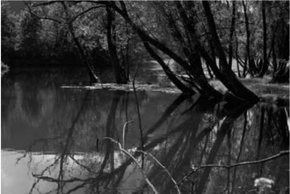
Foto 1: Altwasser „Humme“ bei Plettenberg-Pasel, Lennetal