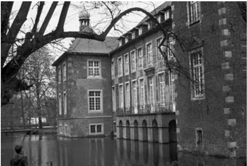
Foto 2: Wasserburg Haus Velen, Westmünsterland, mit Gräfte