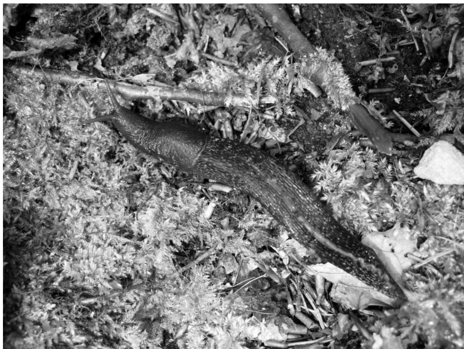
Abb. 1: Der Schwarze Schnegel ( Limax cinereoniger) im Untersuchungsgebiet stellt ein zoogeographisch bedeutsames Vorkommen dar. Das abgebildete Tier stammt vom Steweder Berg bei Stewede im Kreis Minden-Lübbecke und ist am 01.05.2005 aufgenommen worden.