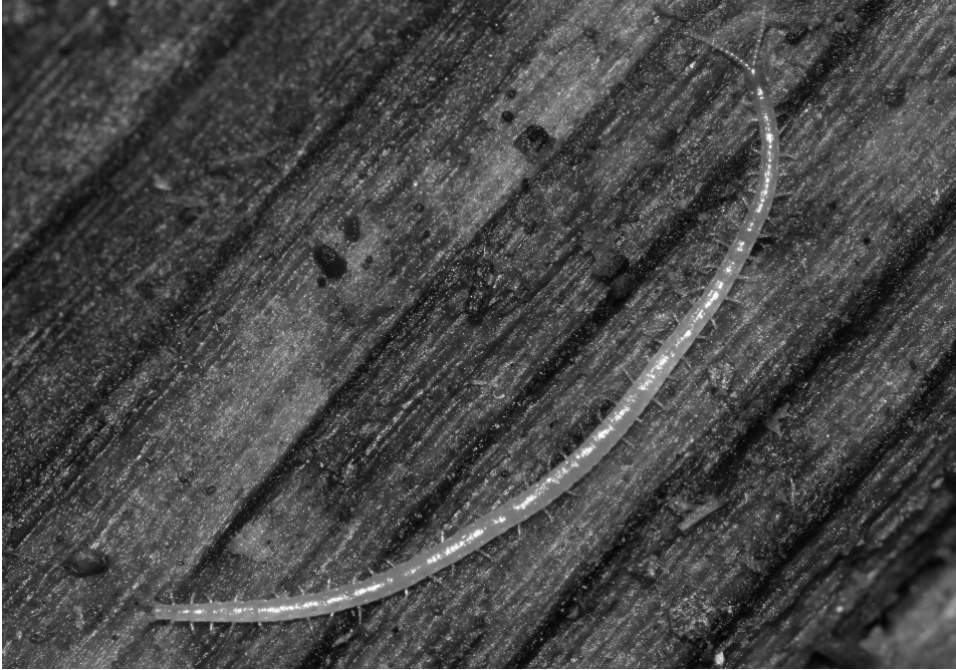
Abb. 1: Schendyla nemorensis ist die am weitesten verbreitete Art der Erdläufer in Nordrhein-Westfalen und kommt als euryöke Art sowohl in Wäldern als auch einer Vielzahl von Offenlandbiotopen vor.