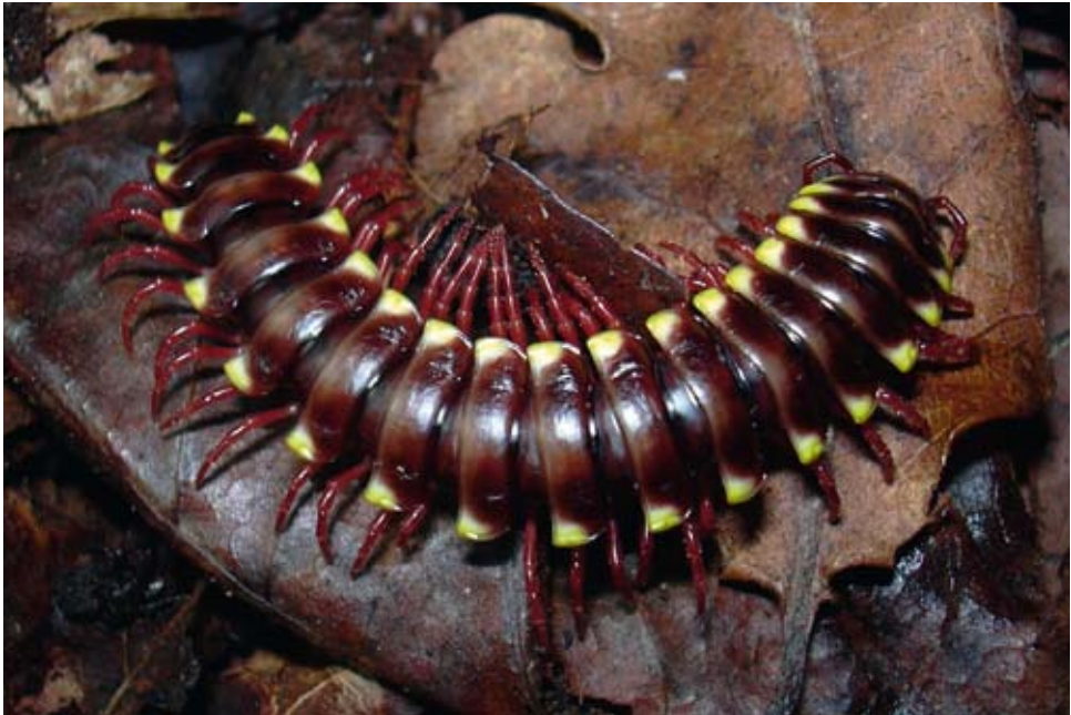
Abb. 5: Chondrodesmus cf. riparius CARL, 1914 wurde in den letzten Jahren mehrfach mittels Zimmerpflanzen eingeschleppt (siehe auch Anm. 42). Der vermutlich ursprünglich aus Kolumbien stammende Bandfüßer (Polydesmida) erreicht eine Gesamtlänge von 5-6 cm.