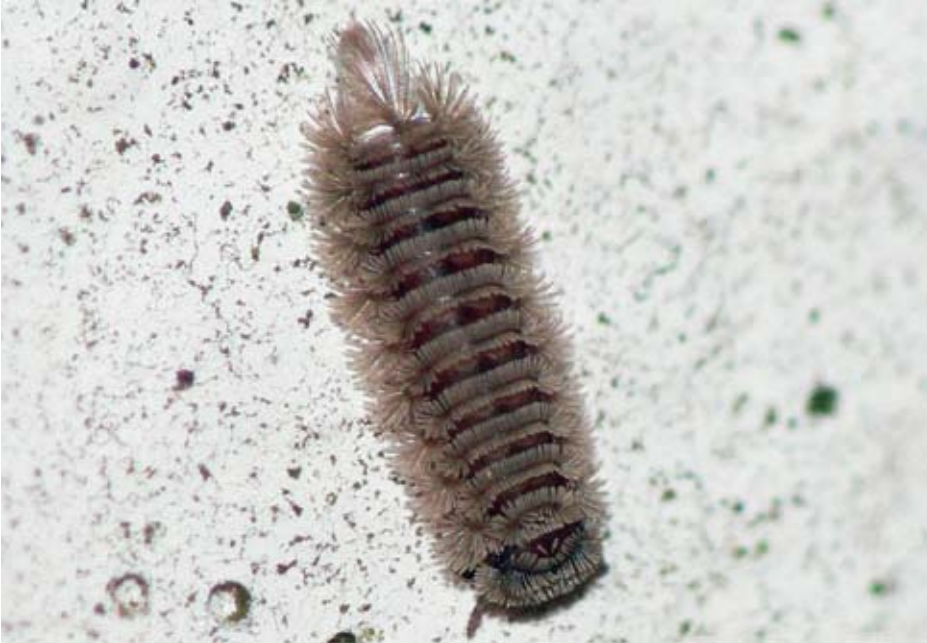
Abb. 3: Polyxenus lagurus (LINNAEUS, 1758) ist mit maximal 3 mm unsere kleinste einheimische Tausendfüßerart mit untypischem Habitus. Der Pinselfüßer ist optimal an das Leben unter Rinde und an Steinwänden angepasst und ernährt sich dort von Algen und Flechten.