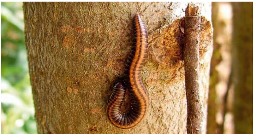
Abb. 6: Ommatoiulus sabulosus (LINNAEUS, 1758) ist im Vergleich zu den anderen einheimischen Schnurfüßern (Julida) auch während der wärmeren Jahreszeit tagsüber epigäisch aktiv. Von dieser, dank der zwei orange-roten, dorsalen Längsstreifen, auffälligen Art liegen mehrfach Berichte über Massenwanderungen vor (VOIGTLÄNDER 2006b).