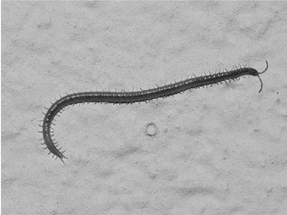
Abb. 10: Geophilus carpophagus LEACH, 1815 ist eine häufig in Menschennähe anzutreffende Erdläufer-Art (Geophilida) mit einer Gesamtlänge von maximal 6 cm und Lumineszenzvermögen. Meist findet man diese grünlich-bräunlich gefärbte Art an Wänden und Obstbäumen.

Die ausgewertete Myriapodenliteratur Nordrhein-Westfalens umfasst zur Zeit 96 sowohl publizierte als auch unveröffentlichte (wie z.B. Diplom- oder Examensarbeiten) Quellenangaben, aus denen 2693 Datensätze (bezogen auf ca. 480 verschiedene Untersuchungsflächen) resultieren. Abb. 11 zeigt die Entwicklung des Erforschungsstandes der Myriapodenfauna in NRW seit Beginn der faunistischen und systematisch-taxonomischen Forschung (BONESS 1953, LEYDIG 1881, STOLLWERK 1883, KOENIKE 1889, VERHOEFF 1891), wobei die Anzahl der Literaturquellen gegen die Zeitachse aufgetragen wurde.