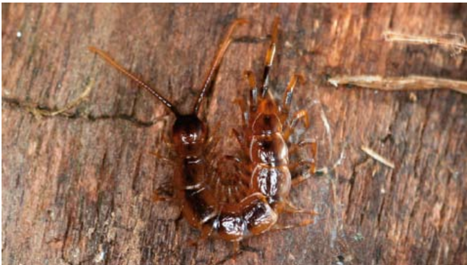
Abb. 2: Lithobius tenebrosus MEINERT, 1872 ist ein typischer Bewohner von Laubmischwäldern der kollinen Stufe im Bergischen Land und dem Sauerland (siehe auch Anm. 8). Im Vergleich zu den anderen Vertretern der Steinläufer (Lithobiida) weist diese Art eine sehr schöne kontrastreiche Färbung auf.