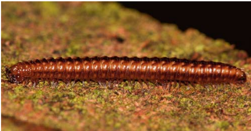
Abb. 8: Craspedosoma rawlinsi LEACH, 1815 ist der häufigste Vertreter der Samenfüßer (Chordeumatida) in NRW und kann als eurytop bezeichnet werden. Die stark beborsteten Jungtiere mit ausgeprägteren Seitenflügeln wurden in der Vergangenheit wiederholt mit anderen Chordeumatiden-Arten verwechselt (siehe auch Anm. 32, 33). adultes Weibchen, 09.04.2006.