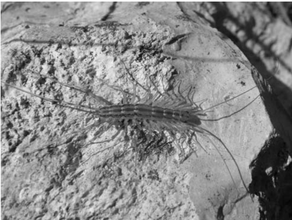
Abb. 13: Scutigera coleoptrata (LINNAEUS, 1758) ist der einzige Vertreter der Spinnenasseln (Scutigeraida) in Deutschland und im mediterranen Raum weit verbreitet (siehe auch Anm. 1).

Der von BROCKSIEPER (1973) im Rahmen ihrer Diplomarbeit aus dem Siebengebirge (Rhein-Sieg-Kreis, Wolkenburg) gemeldete Fund beruht auf einer Verwechslung mit einem Männchen von Lithobius calcaratus (corr. Decker 2009). Ein sicherer Nachweis für Deutschland existiert bisher nicht (SPELDA 2006). Mit dieser von der Slowakei entlang der Karpaten nach Rumänien verbreiteten Spezies (DANYI & KORSÓS 2002) ist in Nordrhein-Westfalen nicht zu rechnen.