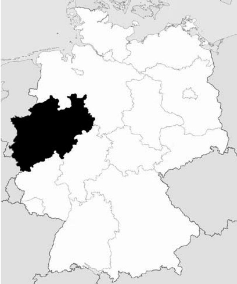
Abb. 9: Lage von Nordrhein-Westfalen (schwarz) in Deutschland.

Der Großteil des im Rahmen der vorliegenden Checkliste untersuchten Materials befindet sich derzeit in der Privatsammlung des Erstautoren. Eine Belegsammlung der meisten dokumentierten Arten ist im LWL-Museum für Naturkunde (Münster) hinterlegt, während zwei Exemplare von Nanogona polydesmoides (LEACH, 1814) der zoologischen Staatssammlung München zur Verwahrung überstellt wurden.