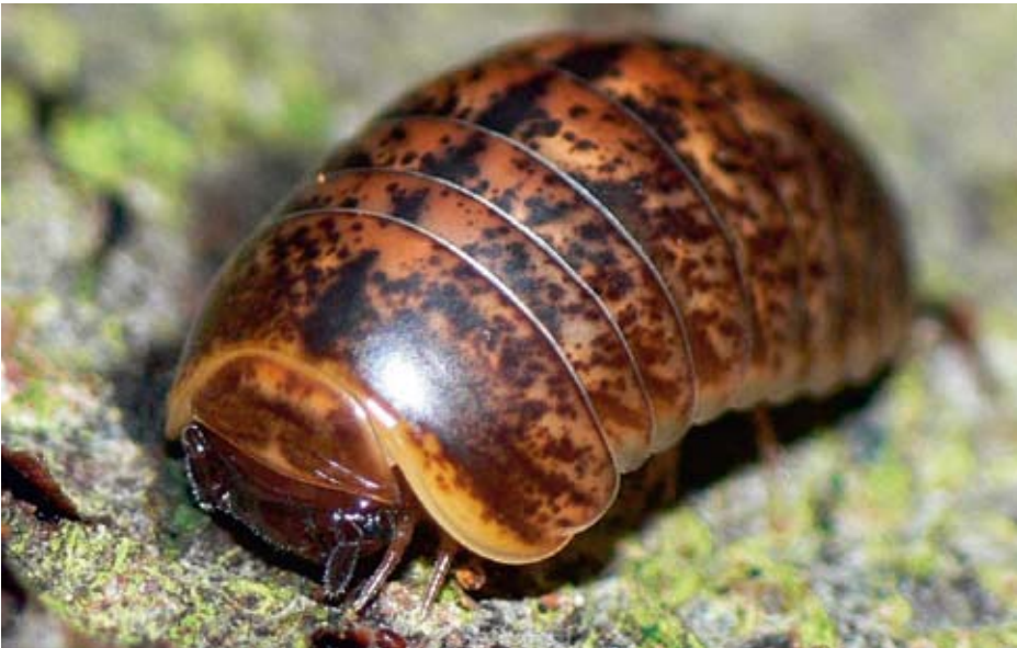
Abb. 4: Glomeris undulata C. L. KOCH, 1844 ist ein Angehöriger der Saftkugler (Glomerida) und nur sehr sporadisch in NRW anzutreffen. Adulte Vertreter dieser Art sind gut durch das prägnante Färbungsmuster von anderen einheimischen Saftkugler-Arten zu differenzieren. Boreholzhausen. Wald. 15.03.2007.