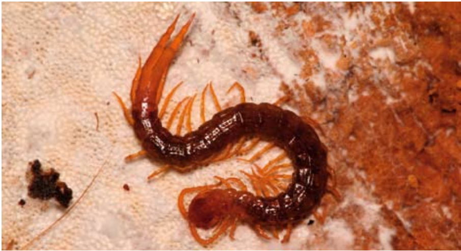
Abb. 1: Cryptops parisi BRÖLEMANN, 1920 ist der häufigste Vertreter der Skolopender (Scolopendrida) in den Wäldern der Mittelgebirgsregionen NRW. Die einheimischen Vertreter der Gattung Cryptops lassen sich durch den Besitz von 21 Beinpaaren und den sehr langen und stark verdickten Endbeinen sehr gut von den Steinläufern (Lithobiida) und Erdläufern (Geophilida) differenzieren. Foto: A. Steiner, Breckerfeld, Gartenterasse, 09.2007.

Repräsentative Vertreter verschiedener Familien der Chilopoda und Diplopoda werden in den Abbildungen 1 bis 8, 10 und 13 dargestellt.