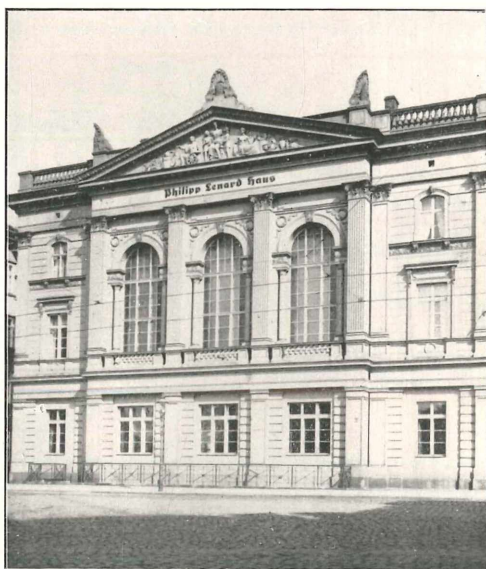
Philipp - Lenard - Haus