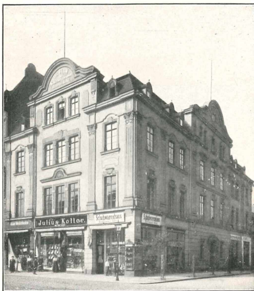
Abraham - Gottlob - Werner - Haus