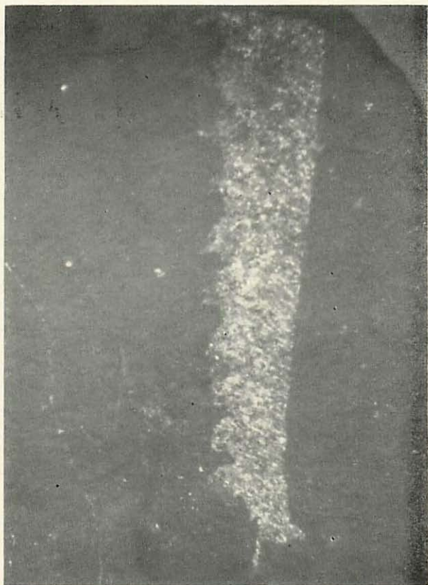
Abb. 6. Monograptus fritschi linearis Bouček. Rengersdorf (Vergr. 11×) (Zu STEIN, Graptolithenfauna der Oberlausitz)