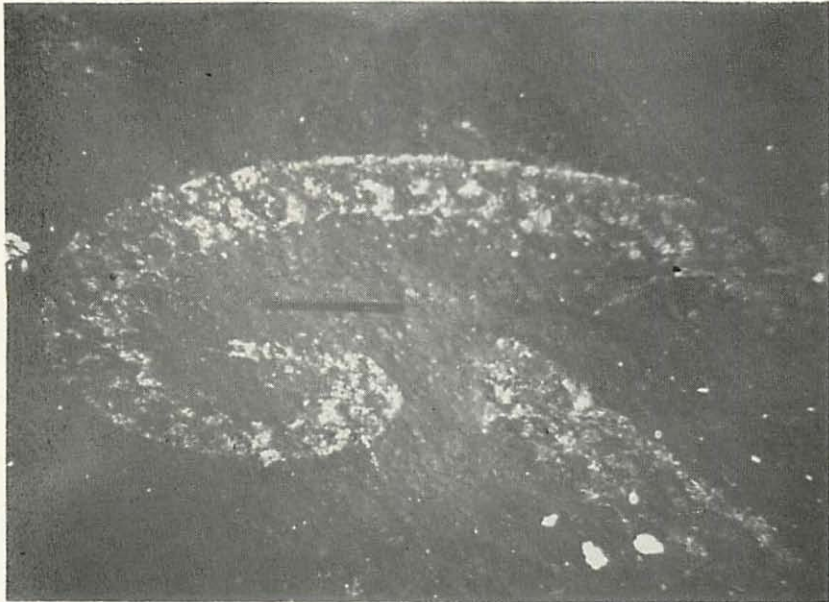
Abb. 8. Monograptus testis Barrande Proximalabschnitt Steinberg bei Lauban (Lubaň) (Vergr. 7X)

Der schwarze Strich gibt die Hauptstreckungsrichtung an (Lb?)