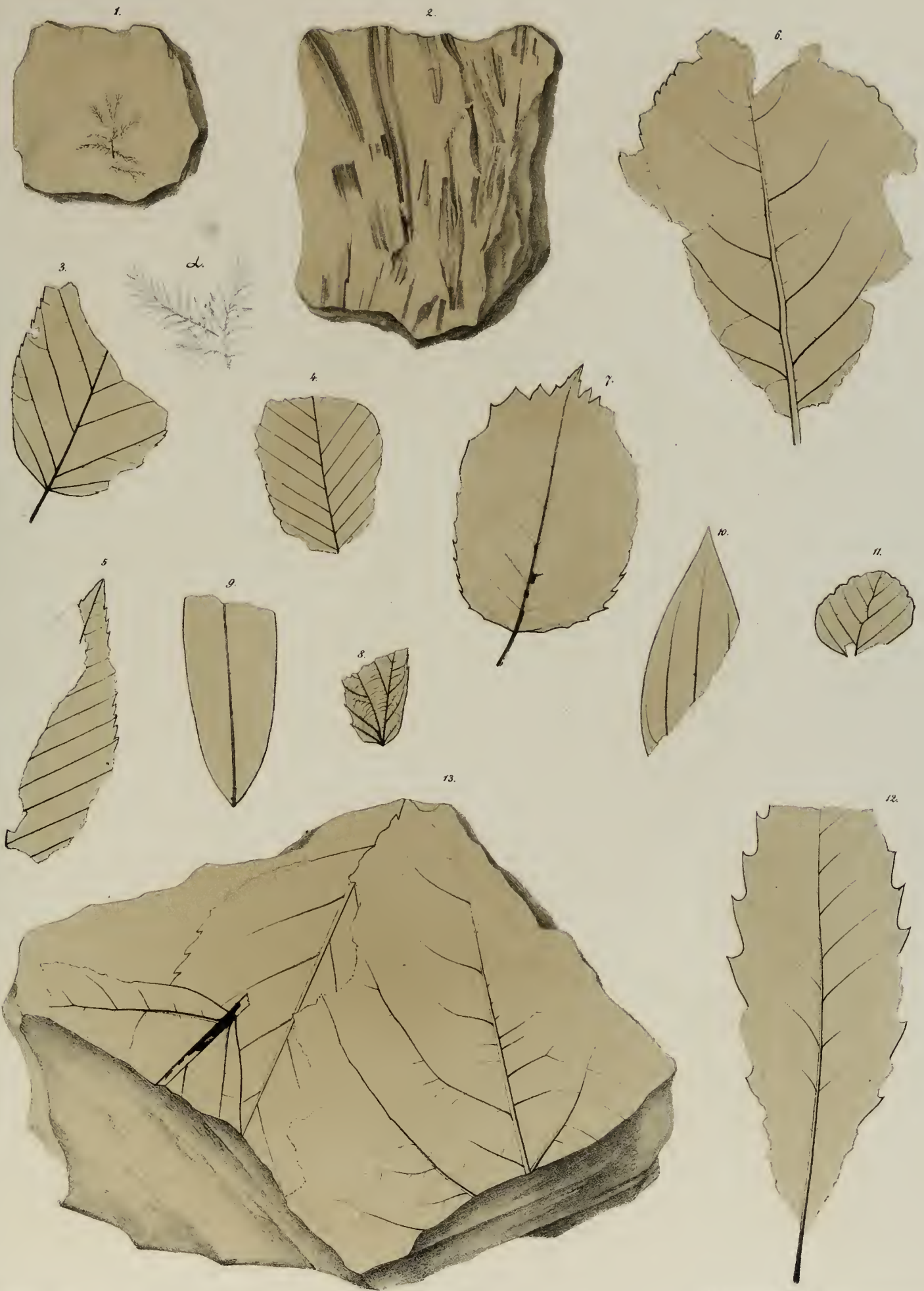
Fig. 1. Hypnum molassicum Ett. „ 2. Cyperites tectarius Ung. „ 3. Betula prisca Ett. „ 4. 5. Betula Brongniartii Ett.