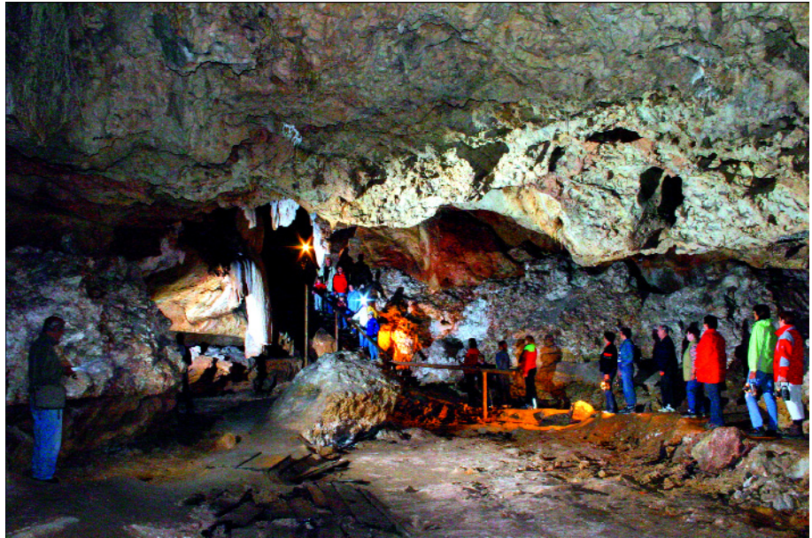
Abb. 4. Die Kraushöhle mit ihren Gipskristallen wurde 1881 für den allgemeinen Besuch erschlossen. Sie war die erste Höhle der Welt mit elektrischer Beleuchtung.

(DONNER, 1975) und entsprechend eindrucksvoll sind die Wassermassen, die aus der Felsspalte stürzen. Wiener fasziniert, dass das soeben aus der Spalte sprudelnde Wasser erst zwei Tage später in der Bundeshauptstadt ankommen wird. Vor allem im Frühjahr hautnah erlebbar ist das Wasser in der Wasserlochklamm ( www.wasserloch.at ) von Palfau (Abb. 5), die tief im triadischen Dolomit eingeschnitten ist und über eine Steiganlage zu begehen ist.