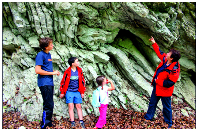
Abb. 1. Dass die gefalteten Gesteine einst weicher Meeresschlamm waren, versetzt nicht nur Kinder in Staunen. Dass sie zur Oberalm-Formation (Oberjura) gehören, ist in diesem Zusammenhang eher von untergeordneter Bedeutung.

Bei dem Erwerb geologischen Wissens zeigt sich eine eigenartige Diskrepanz: Auf der einen Seite steht das freiwillige Erlernen aller möglichen (und oft unmöglichen) Information über fossile Vertebraten, insbesondere Dinosaurier. Auf der anderen erfreut sich der Geologieunterricht in den Schulen sowohl bei Lehrern als auch Schülern im Allgemeinen größter Unbeliebtheit. Interesse für die Geologie zu wecken (Abb. 1) ist die große Chance der Geoparks (KOLLMANN, 2007). Genutzt kann sie allerdings nur dann werden, wenn man den Vorstellungen der Besucher entgegenkommt, die kein Bildungs-, sondern ein Freizeitangebot erwarten. Gefragt ist daher nicht der Lehrpfad, wie ihn viele Institutionen mit viel Liebe aber wenig Erfolg einrichten, sondern das gemeinsame Entdecken und das Abenteuer mit Spiel, Spaß und manchmal einer Portion Nervenzitkel. Stimmen muss natürlich auch das touristische Umfeld (Restaurants, Hotels, Veranstaltungen, etc.).