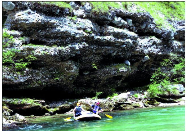
Abb. 8. GeoRafting ist eine geführte Rafttour auf der Salza. Die Kulisse der canyonartig in die eiszeitlichen Konglomerate eingeschnittene Flussstrecke war Geotop des Jahres 2005 in der Region.