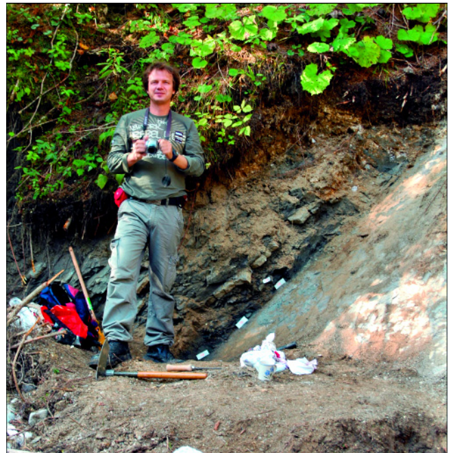
Abb. 3. Aktuelle wissenschaftliche Untersuchungen an der Kreide/Tertiär-Grenze im Geopark bringen auch den Wissenschaftlern neue Erkenntnisse.