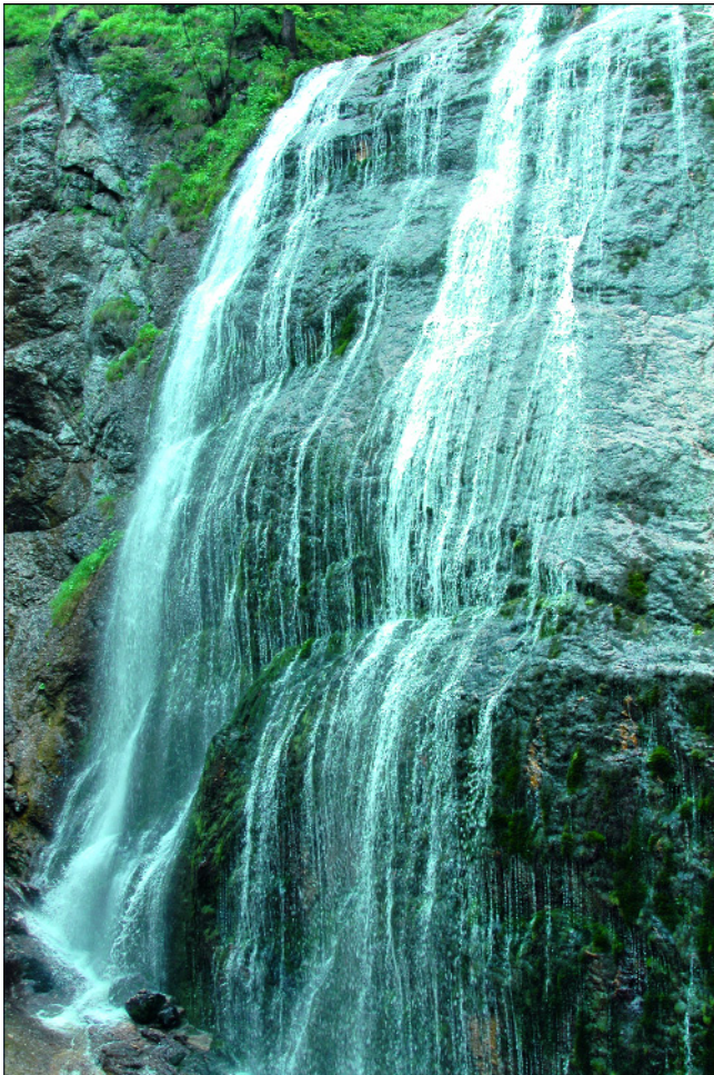
Abb. 5. Der Besuch der tief in triadischen Dolomit eingeschnittenen Wasserlochklamm bei Palfau ist vor allem an heißen Sommertagen sehr zu empfehlen.

Das Wasserleitungsmuseum in Wildalpen ( www.wien.gv.at/wienwasser/wildalpen/index.html ) befindet sich am Ausgangspunkt der 2. Wiener Hochquellenleitung. Geologie, Technik und Geschichte sind seine Hauptabschnitte.