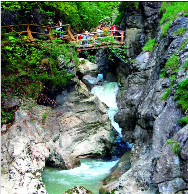
Abb. 2. Eine Steganlage erschließt die 1972 zum Naturdenkmal erklärte Noth-Klamm mit ihren beeindruckenden Kolken.

Eindrucksvoll ist der Besuch der Kläfferquelle, der bedeutendsten Karstquelle der Zweiten Hochquellenleitung, die von hier das Wasser über eine fast 200 km lange Leitung nach Wien bringt. Die kleinste bei der Kläfferquelle gemessene Schüttung beträgt fast 60.000 m 3 pro Tag