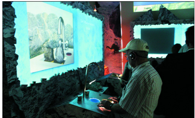
Abb. 6. Im Nationalparkpavillon Gstatterboden wird Geologie durch eine interaktive Ausstellung erlebbar.

Im GeoZentrum Gams werden Episoden aus der geologischen Geschichte der Region gezeigt (KOLLMANN, 2002).