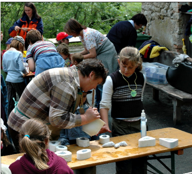
Abb. 7. Das Mit-nach-Hause-Nehmen der in der GeoWerkstatt selbst hergestellten Abgüsse ist ein wesentlicher Faktor für positive Assoziationen im Zusammenhang mit dem Geopark.

Eine alte Weisheit besagt, dass Tourismus die Zerstörung seiner eigenen Grundlagen herbeiführt. Im Nationalpark hat der Schutz mitsamt einer wissenschaftlichen Betreuung Vorrang. Etwas differenzierter ist die Situation im Naturpark. Laut Naturschutzgesetz des Bundeslandes