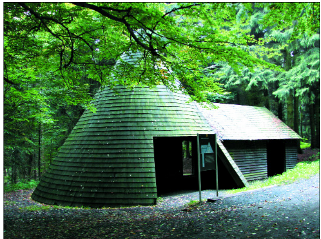
Abb. 2. Ausflugsziel „Göpelhaus am Schacht Moses“ am Bergbaurundweg im Muttental. Auf 9 km Weglänge und mit 41 Infostationen bekommt der Besucher einen Einblick in die Bergbaugeschichte und Geologie im Muttental.

Vor dem Hintergrund der Zielsetzung des GeoParks Ruhrgebiet e.V. bereits vorhandene Aktivitäten und Projekte aus der Region zu bündeln, um eine höhere Effizienz in der Region erreichen zu können, bietet die AG Pädagogik mit einem „virtuellen Infobrett“ auf der Homepage des GeoParks ( www.geopark-ruhrgebiet.de ) einen Einblick in ein bereits vielfältiges Angebot an geodidaktischen Aktivitäten im Revier. Hier werden sowohl im Bereich der Erwachse-