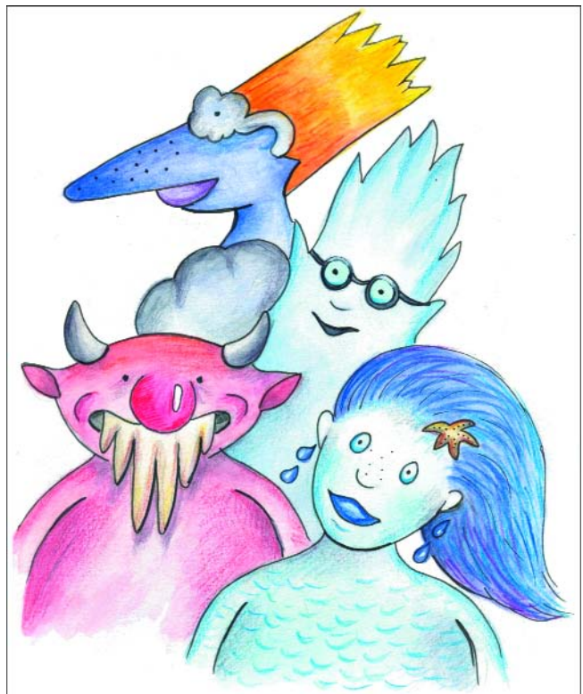
Abb. 3. Die Figuren „Lebensgeist, Wetterhexe, Wasserweib und Erdteufel“ begleiten als Erzähler die Erdgeschichten aus dem Muttental und tauchen in zahlreichen Abbildungen des geplanten Kinderbuches auf. Zeichnung: K. SCHÜPPEL.

Die erfolgreiche Umsetzung aller Projekte der AG Pädagogik kann nur mithilfe des großen Interesses und Engagements seiner Mitglieder umgesetzt werden. Wunsch und langfristiges Ziel des GeoPark Ruhrgebietes ist es, die laufenden Projekte zu intensivieren und mit bereits bestehen-