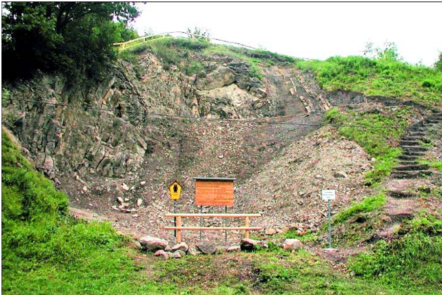
Abb. 1. Die Schottergrube Haarhausen – Aufschluss der Nordost-Randstörung des Wachsenburggrabens (Teil der Eichenberg-Gotha-Arnstadt-Saalfelder Störungszone).

Durch bruchtektonische Bewegungen („saxonische Tektonik“), die im Zusammenhang mit der alpidischen Tektonogenese stehen, wurde der Thüringer Wald herausgehoben und so die älteren Anteile des Untergrundes exhumiert. Die gleichen Bewegungen bewirkten entlang der Eichenberg-Gotha-Arnstadt-Saalfelder Störungszone im Drei-Gleichen-Gebiet, das der jüngere Teil der Schichtenfolge in Grabenstrukturen relik-tisch erhalten blieb. Die Schichten des Oberen Keupers und des Jura sind sonst in Mitteldeutschland großflächig abgetragen. Diese Grabenzone ist auch ein herausragendes Beispiel für Reliefumkehr.