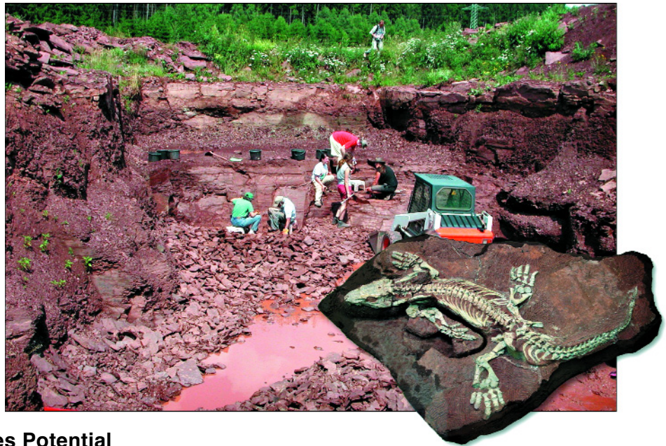
Abb. 2. Wissenschaftliche Grabung des Museums der Natur Gotha am Bromacker bei Tambach-Dietharz. Ein Fund aus dem Jahr 1998: Orobates pabsti .