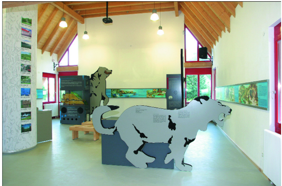
Abb. 2. Das HöhlenHaus in Giengen-Hürben bietet dem Besucher einen Einblick in die regionale Erdgeschichte mit Schwerpunkt auf die Besonderheiten der Karstlandschaft der Region bzw. dem Lonetal.

der Hochgebirgskarst und der tropische Kegelkarst dargestellt.