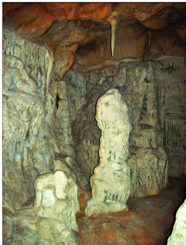
Abb. 7. Im NÖ. Landesmuseum (St. Pölten) wurde die Höhle nach Abgussformen, die in der Grasslhöhle (Steiermark) abgenommen wurden, in modifizierter Form frei aufgebaut.

Im Themenbereich Paläontologie wurde eine Höhle naturgetreu nachgebaut, wo Erscheinungen wie Tropfsteine, Höhlensee, Höhlenbären und das Leben des Men-