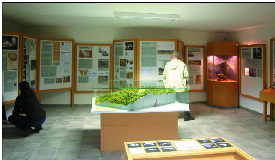
Abb. 5 Blick in das 2005 neuingerichtete Höhlenmuseum an der Einhornhöhle.

Die Heimkehle wurde bereits erstmals 1357 urkundlich erwähnt. Eine Erschließung für den Besucher erfolgte aber erst 1920. 1944 wurden Teile der Höhle als Rüstungsbetrieb ausgebaut, wodurch der Schauhöhlenbetrieb zum Erliegen kam. Erst 1954 konnte die Höhle wieder für den Besucherverkehr freigegeben werden (BINDER et al., 1993). Insgesamt ist die Höhle 1800 m lang.