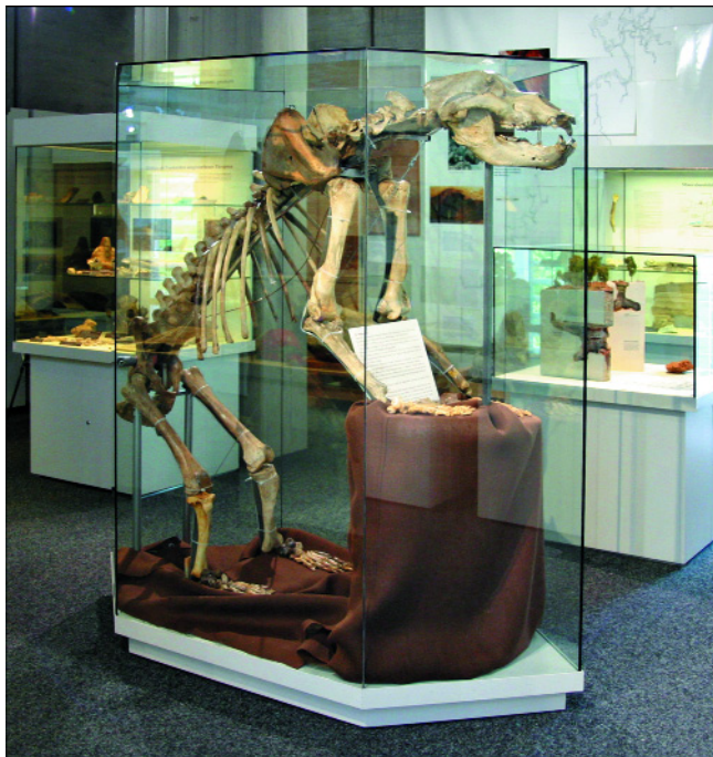
Abb. 3. Besonderer Blickfang in der Ausstellung der Abteilung zur Karst und Höhlenkunde im Museum „Natur und Mensch“ der Naturhistorischen Gesellschaft Nürnberg ist das Skelett eines ungewöhnlich großen Höhlenbärenindividuums.

Weitere Informationen über die Naturhistorische Gesellschaft, ihre Abteilungen und das dazugehörige Museum finden sich unter www.nhg-nuernberg.de .