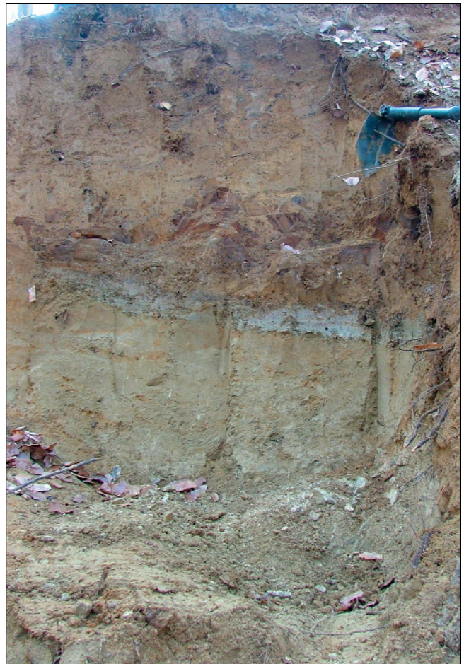
Abb. 2. Quartäre Deckschichten über Anstehendem in der Hagenbachklamm. Über verwittertem Mürlsandstein ist über der Basislage (Profilmitte) eine Hauptlage entwickelt.

Sowohl die gesteinsbedingten Eigenschaften des Anstehenden als auch die bodenmechanischen Eigenschaften der quartären Sedimente steuern die Dynamik an den Hängen des Hagenbachtals (u.a. GÖTZINGER, 1943; DAMM & TERHORST, 2008; TERHORST et al., 2008). Hier treten neben flachgründigen Rutschungen in verwitterten Sandsteinen auch mittelgründige Rutschungen (Mächtigkeit 3–5 m) in den quartären Deckschichten auf. Dabei gleiten häufig Lössdecken auf wasserstauenden Horizonten ab.