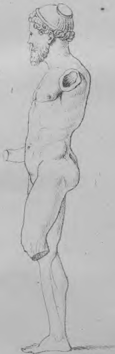
Fig. 56. 57.