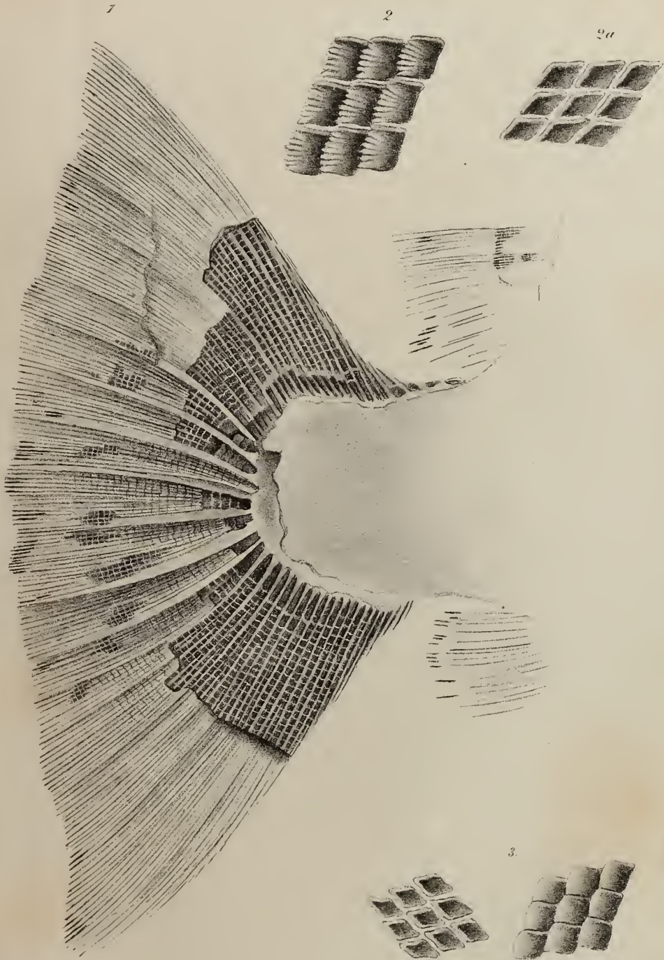
1. Mesturus . 2. Lepidotus decoratus . 3. Lepidotus intermedius .