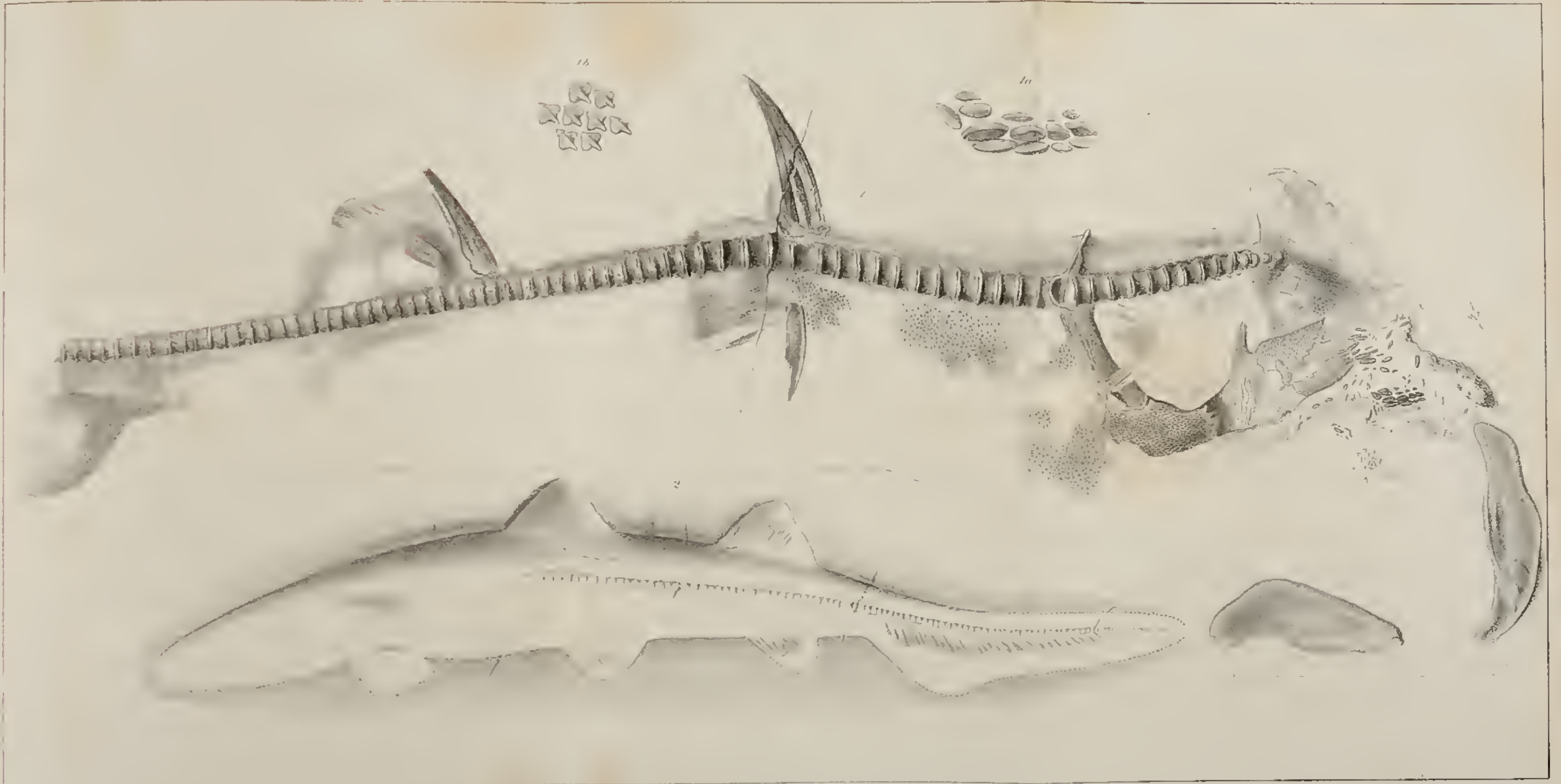
1. Aerolus falcrifer , 2. Palaeoscyllium formosum .