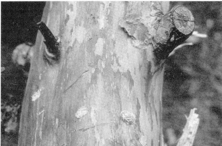
Abb.3) Vorgefertigte Schlupflöcher von Buprestis bertheloti LAPORTE et GORY