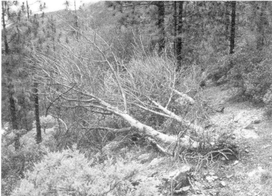
Abb.2) Brutplatz von Buprestis bertheloti LAPORTE et GORY im Biotop des Pinar de Tamadaba