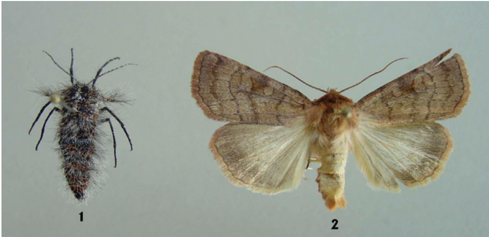
Sl. 2: Primerki na novo najdenih osebkov: 1- samica vrste Lycia isabellae , 2 – samček vrste Xestia sexstrigata .