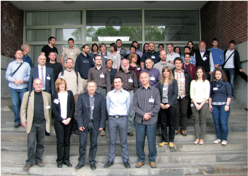
Slika 1: Udeleženci 4. slovenskega entomološkega simpozija z mednarodno udeležbo, Maribor

Na Fakulteti za naravoslovje in matematiko Univerze v Mariboru je potekal tokrat že 4. slovenski entomološki simpozij z mednarodno udeležbo. Simpozij so že drugič zapovrstjo organizirali zoologi Oddelka za biologijo v Mariboru s pomočjo Slovenskega entomološkega društva Štefana Michielija, Fakultete za naravoslovje in matematiko, Oddelka za biologijo FNM ter Inštituta za biologijo, ekologijo in var-