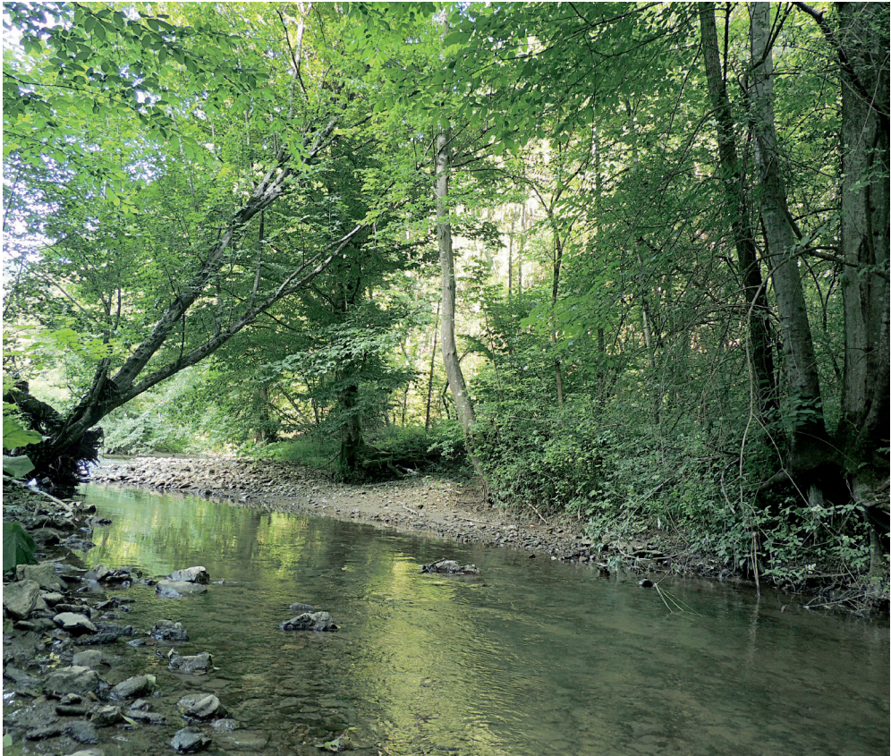
Abb. 1: Fundstelle bei Velika Pirešica