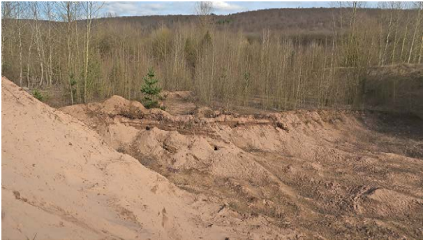
Abb. 2: Sandgrube der Betriebsfläche. März 2020