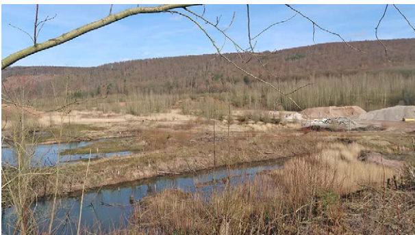
Abb. 4: Sicht auf den südlichen Teil der Abbaufäche. März 2020