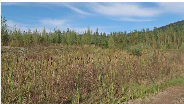
Abb. 5: Röhrichtbestand in der Abbaufäche. August 2020

Wildbienen-relevante Blütenpflanzen sind hier in erster Linie der großflächig vorkommende Solidago spp., zahlreiche Salix -Arten, Lythrum salicaria und diverse