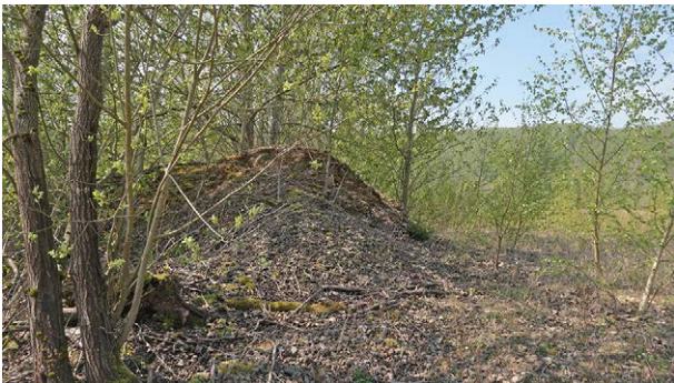
Abb. 3: Fortgeschrittene Sukzession im Halboffenland Südost. März 2020