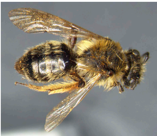
Abb. 1: Andrena rufula ♀ aus Ungarn, Balaton.