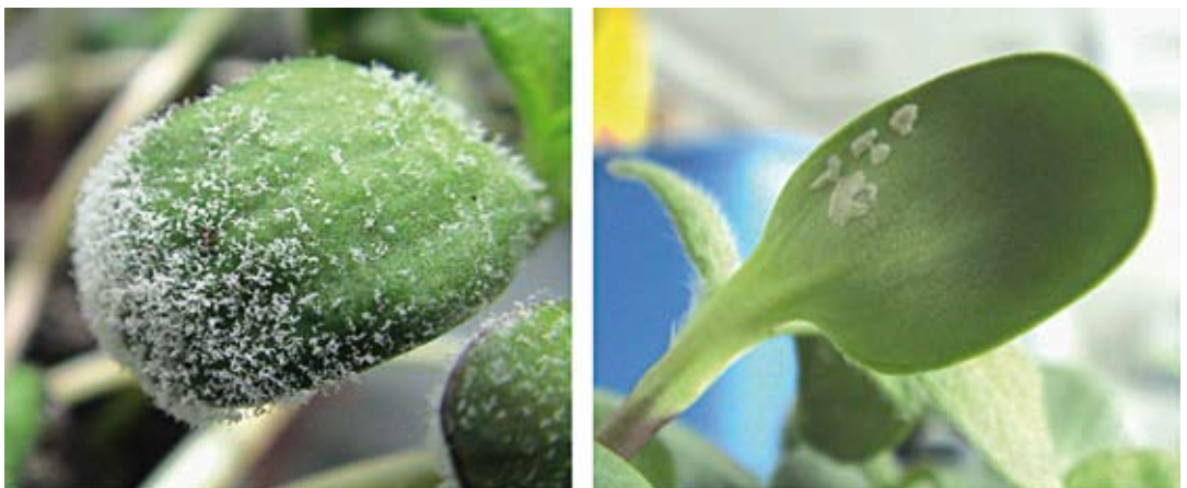
Abbildung 2. Sporulation von Falschen Mehltauipilzen (Beispiel Plasmopara halstedii ; links) und Weißrosten (Beispiel Pustula helianthicola ; rechts) an Keimblättern der Sonnenblume.