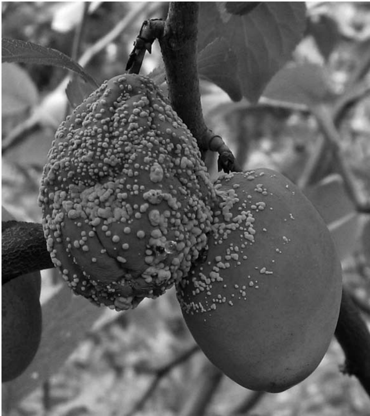
Abbildung 3. Monilia -Fruchtfäule an Zwetschgen.

Baden-Württemberg und anderen Regionen mit intensivem Zwetschgenanbau verstärkt und weit verbreitet Probleme mit Fäulnis von Früchten im Nacherntebereich auf. Obwohl augenscheinlich gesunde Zwetschgen von den Erzeugern für die Vermarktung erfasst wurden, kam es im Lager bzw. auf dem Weg zum Kunden innerhalb von nur wenigen Tagen nach Anlieferung zur Fäulnis der Früchte. Als Hauptschaderreger wurden die Monilia -Arten M. laxa und M. fructigena identifiziert. Die Monilia -Fäule im Lager trat unabhängig von der Intensität des Pflanzenschutzmitteleinsatzes auf. So kam es an Früchten aus Anlagen mit einem intensiven Fungizideinsatz zur Fäule, während in anderen Anlagen mit nur geringem Pflanzenschutzmitteleinsatz die Monilia -Fruchtfäule zu vernachlässigen war. Dies führte zu den Annahmen, dass die Pflanzenschutzmittel nicht mehr wirksam sind oder zu einem falschen Zeitpunkt in der Entwicklung von Baum und Pilz eingesetzt wurden.