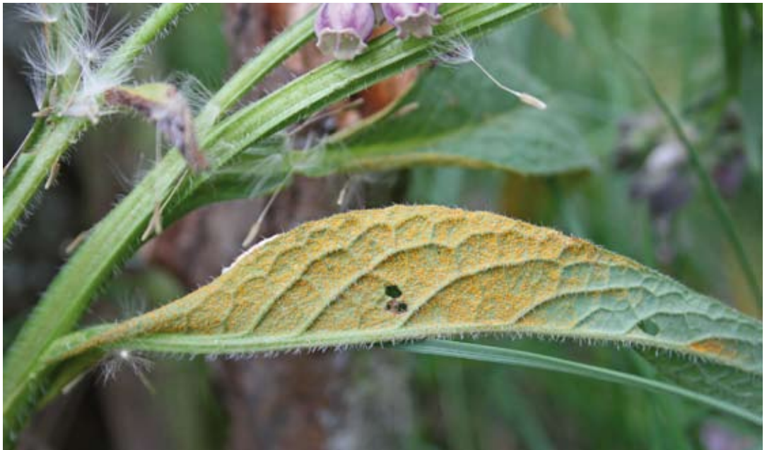
Abbildung 2. Mykologischer Forschungsschwerpunkt am Karlsruher Naturkundemuseum sind die pflanzenparasitischen Rostpilze (Pucciniales), hier eine Art ( Melampsorella symphyti ) auf der Blattunterseite des Beinwells.