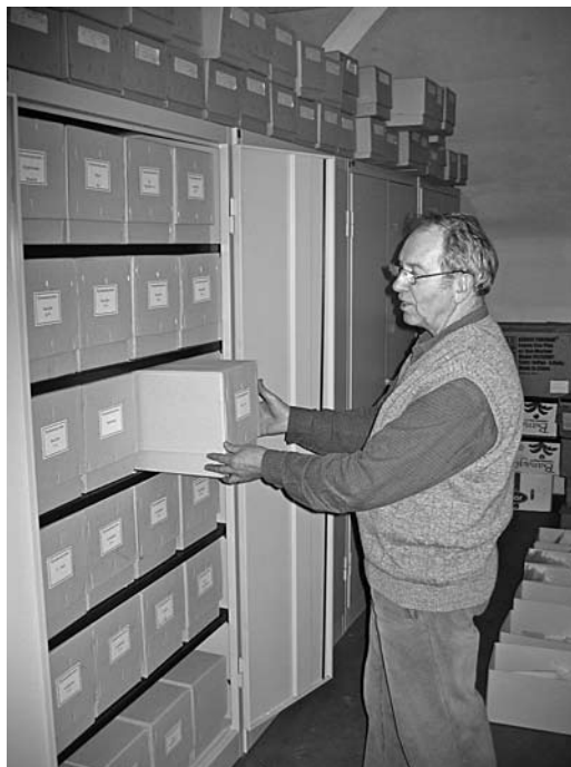
Abbildung 1. Stahlschränke im Pilzherbarium des Karlsruher Naturkundemuseums, in denen Großpilze in großen Kartons alphabetisch nach wissenschaftlichen Namen geordnet werden.

2003 wurde mit dem Autor erstmals ein Mykologe am Karlsruher Museum eingestellt mit dem Auftrag, ein Pilzherbarium mit Schwerpunkt Baden-Württemberg aufzubauen. Bis zu diesem Zeitpunkt wiesen die Sammlungen, Flechten nicht berücksichtigt, lediglich ca. 11.800 Belege auf, verstaut im Dachstuhl des Hauptgebäudes (Abb. 1). Diese waren taxonomisch-nomenklatorisch veraltet und in präparatorisch schlechtem Zustand: Ein Großteil der Blätterpilze und Röhrlinge war durch Insektenfraß zu Staub verfallen und damit wertlos. Die Nichtblätterpilze und die pflanzenparasitischen Kleinpilze wurden weitgehend von Insektenfraß verschont. Ein Teil der Sammlungen wies auch Schimmelbefall auf. Die wichtigste Sammlung innerhalb dieser Altbestände stammte von dem Wertheimer Lehrer WILHELM STOLL (1832-1917) mit rund 1.100 Belegen. In der Folgezeit konnte die Sammlung durch Schenkungen, einige wenige Aufkäufe und eigene Aufsammlungen bis Dezember 2011 auf rund 45.600 Belege erweitert werden. Somit ist die Karlsruher Pilzsammlung die am schnellsten wachsende und die zweitgrößte in Baden-Württemberg (vgl. Tabelle 1). Zu den wissenschaftlich bedeutendsten Sammlungen gehören (Schwerpunkt der Aufsammlungen in Klammern): JOSEPH CHARLES ARTHUR (Rostpilze, Nord- und Mittelamerika, Dubletten), ELSWORTH BETHEL (Rost-