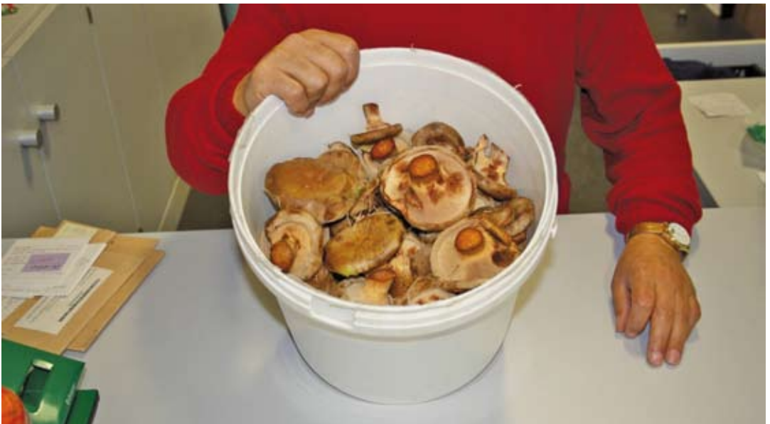
Abbildung 2. Ein Eimer voller Kahler Kremplinge wurde 2011 zur Pilzberatung gebracht. Der Verzehr der Art kann tödlich sein.