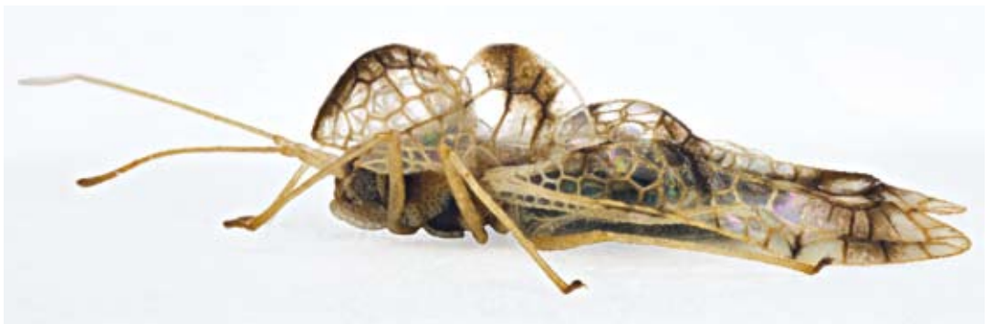
Abbildung 1. Stephanitis (Stephanitis) lauri nov. spec., ♂, Paratypus, coll. STRAUSS, Biberach. – a) Aufsicht; b) Seitenansicht.