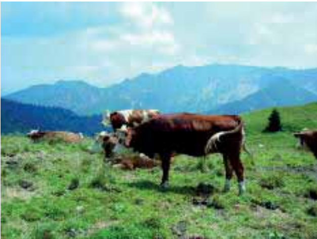
Abbildung 1: Almlandschaften üben auf Menschen einen besonderen Reiz aus und bedeuten für das Vieh eine natürliche und artgerechte Haltungsform

Figure 1: Alpine pasture landscapes have a special attraction for humans and also suggest that the livestock are being kept in a natural way appropriate to the species