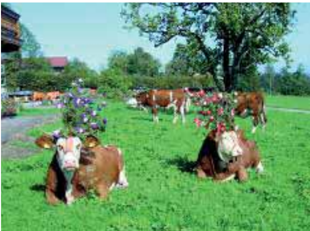
Abbildung 2: Nach einem langen Almsommer, der ohne Unfälle verlief, kehrten die Kühe geschmückt zurück in den Talbetrieb

können. Künftig wird bei knappen öffentlichen Kassen ein Verteilungskampf zwischen den Bereichen stattfinden, die staatliche Mittel beanspruchen. Die Berglandwirtschaft kann hier von dem hohen Ansehen in breiten Bevölkerungskreisen profitieren. Den Menschen ist bewusst, dass es bei der Erhaltung der alpinen Landschaft keine Alternative zur bäuerlichen Landwirtschaft gibt. Es bleibt zu hoffen, dass dies auch für die Zukunft gilt. Für das Selbstverständnis der Bauern hat der Verkauf ihrer Produkte (= Wert der eigenen Arbeit) einen deutlich höheren Stellenwert als die vom Staat gewährten Förderungen. Dem hohen bürokratischen Aufwand zur Abwicklung der Förderprogramme sowie den oft unüberschaubaren Verpflichtungen und Kontrollen steht der Landwirt oft hilflos und frustriert gegenüber. Er fühlt sich zum Bittsteller degradiert.