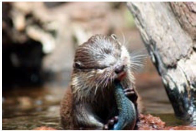
Abbildung 3: In Ostbayern vom Fichtelgebirge bis zur Donau schätzt man den Bestand an Fischottern auf circa 300 Individuen.

Insgesamt hat sich das Verbreitungsgebiet des Fischotters in Ostbayern geschlossen beziehungsweise geringfügig erweitert, vor allem am Rande der Schwerpunktorkommen im Bayerischen Wald. Auch im Bereich des Frankenwaldes in Nordbayern deutet sich eine geringfügige Expansion an. Die noch bestehenden Verbreitungslücken südlich und nördlich des Fichtelgebirges lassen sich im Wesentlichen durch die eingeschränkte Habitateignung dieser Gebiete (höherer Anteil Acker- und Siedlungsflächen, vergleiche LWF 2008) erklären. Generell sind die Bereiche westlich des bisherigen Verbreitungsschwer-