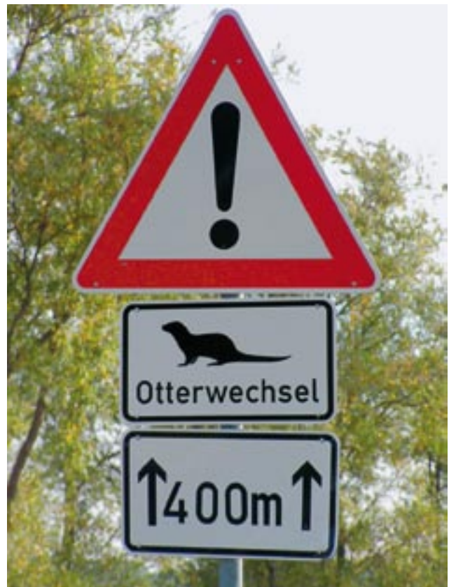
Abbildung 2: Vielleicht müssen diese Schilder auch in Bayern in Zukunft entlang von manchen Straßen aufgestellt werden.

Südostbayern (Abbildung 1). Die übrigen sind echte Neunachweise. Zusammen mit einem weiteren Neunachweis im Rahmen des Projekts „Otterfranken“ erhöhte sich damit die Zahl der MTB mit Nachweisen von 72 auf 95 um 32%. Auf der anderen Seite konnten die Vorkommen des Fischotters östlich von Berchtesgaden, bei Treuchtlingen und im Raum Starnberg/Schäftlarn (insgesamt 4 MTB) nicht bestätigt werden.