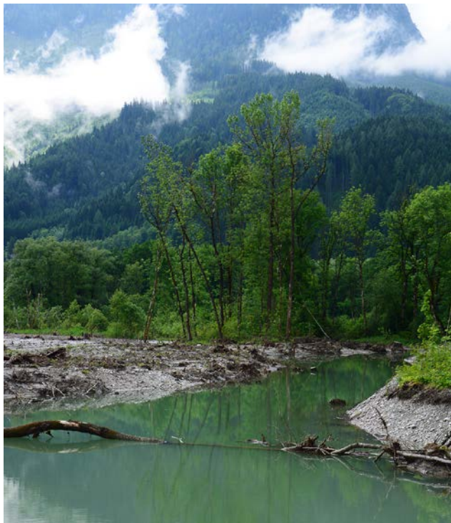
Frisch von einem starken Hochwasser durchspülter Altarm, der kurz zuvor an einen Wildfluss (Enns) angeschlossen wurde. Derartige Altarme haben eine hohe Bedeutung als Laichplätze für manche Fischarten.

(AZ) Zur Renaturierung von Fließgewässern sollten Abschnitte ausgewählt werden, in deren Nähe genügend große Quellpopulationen vorkommen, von denen sich die gewünschten Fischarten ausbreiten können, so das Ergebnis einer Untersuchung der Senckenberg Gesellschaft für Naturforschung und des LOEWE Biodiversität und Klima Forschungszentrums. Die Forscher konnten belegen, dass Fischarten meist dort wieder einwandern, wo schon das biologische Umfeld eine hohe Vielfalt bietet. Damit bestimmt das Artenspektrum der Umgebung maßgeblich den Erfolg von Restitutionsmaßnahmen, was daher schon bei der Planung der Maßnahmen berücksichtigt werden sollte.