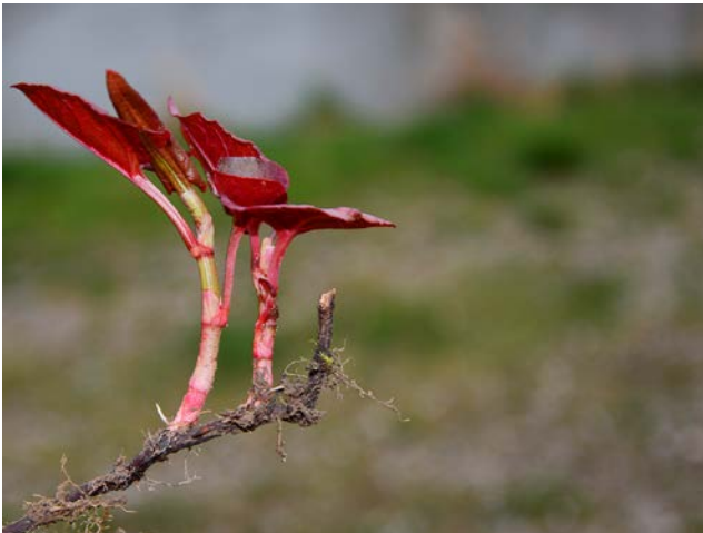
Aus einzelnen verschleppten Rhizomstücken konnte sich ein Bestand des invasiven Staudenknöterichs ( Fallopia japonica ) etablieren. Der Bestand hat sich seit der Etablierung in zwei Jahren bereits auf 4 m 2 Fläche ausgedehnt.

Zehn invasive Pflanzenarten weisen bisher nur wenige, zum Teil deutlich voneinander entfernte Vorkommen auf. Diese Arten wurden auf einer Aktionsliste zusammengestellt, da eine Chance besteht, mit relativ geringem Aufwand die Gefährdung der biologischen Vielfalt durch eine vollständige Beseitigung frühzeitig abzuwehren. Auf der Aktionsliste finden sich zum Beispiel der Große Wassernabel ( Hydrocotyle ranuncu-