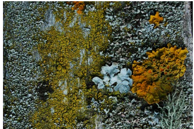
Im Gegensatz zu diesen häufigen Flechtenarten sind viele Baumflechten Indikatoren für wertvolle, alte Lebensräume.

Mehr: SCHEIDEGGER, C. et al. (2014): Artenförderung per Transplantation. – Pro Natura Magazin 1/2014: 2 S.