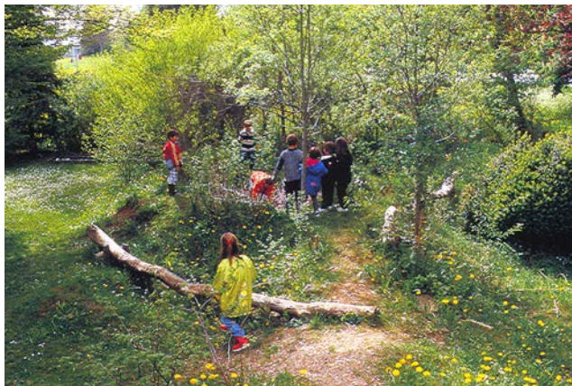
Reich strukturierter Spielraum des Kinderhauses Naturkinder St. Georg, Pöding.

Teil Eins des Werkes fasst den Sachstand und die bisherigen Erfahrungen mit Naturerlebnisräumen zusammen. Dabei hat sich in der Untersuchung erschreckenderweise gezeigt, dass es oft wohl nicht mehr ausreicht „nur“ eine Fläche zur Verfügung zu stellen, sondern auch eine darüber hinausgehende Grundbetreuung nötig ist. Diese muss überhöhte Ängste zu Sicherheitsrisiken abbauen oder gar „Anleitungen“ geben,