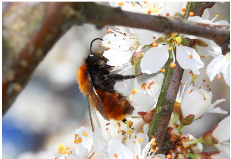
Auch Wildbienen (hier Andrena fulva ) spielen bei der Bestäubung von Nutzpflanzen, wie Apfel- oder Birnbäumen, eine große Rolle (Foto: piclease/Holger Duty).

ROLLIN, O. et al. (2013): Differences of floral resource use between honey bees and wild bees in an intensive farming system. – Agric. Ecosystems and Envir. 179(1): 78–86; www.cebc.cnrs.fr/publipdf/2013/RAEE179_2013.pdf .