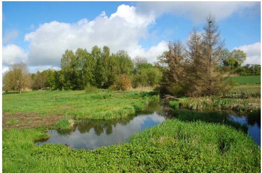
Einstau einer Wiese und abgestorbene Fichten durch einen Biberdamm in einem Mittelgebirgsbach. Der Bereich wurde als Naturentwicklungsfläche angekauft.

Durch freiwillige finanzielle Leistungen Bayerns können anerkannte Schäden bis maximal 80 % ausgeglichen werden. Ausgleichbar sind land-, forst- und fischereiwirtschaftliche Schäden, wie beispielsweise durch Fraß und Vernässung, Uferabbrüche oder Maschinenschäden in der Landwirtschaft, sofern sie binnen einer Woche an die Kreisverwaltungsbehörden geleitet werden. Dabei wird auch geprüft, ob verhältnismäßige und zumutbare präventive Maßnahmen notwendig sind, um wiederkehrende Biberschäden zu vermeiden. Nicht ausgeglichen werden Schäden der öffentlichen Hand und sonstiger juristischer Personen des öffentlichen Rechts.