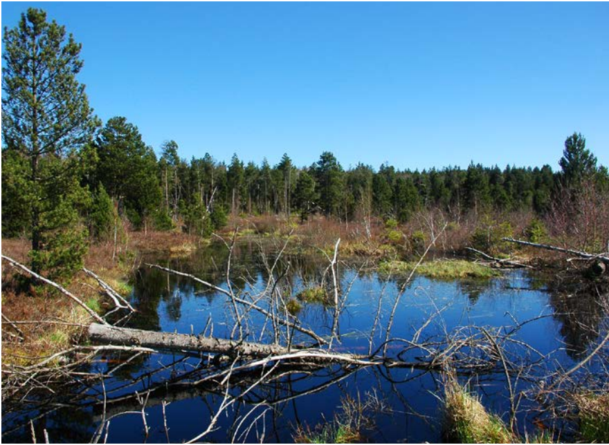
Die Renaturierung von Mooren erhält spezielle Lebensgemeinschaften und dient mit vergleichsweise geringem Finanzmitteleinsatz dem Klimaschutz: Wassereinstau in ehemalige Torfstiche des Ochsenfilzes (Rott 2011).

verschiedlichste Lebensräume – von Korallenriffen, Meeresküsten und Feuchtgebieten über Grasländer bis zu Wäldern einschließlich tropischer Regenwälder. Dabei zeigte sich, dass die meisten Renaturierungsprojekte einen Nettotonnenwert bringen, selbst unter der Annahme, dass ein Ökosystem