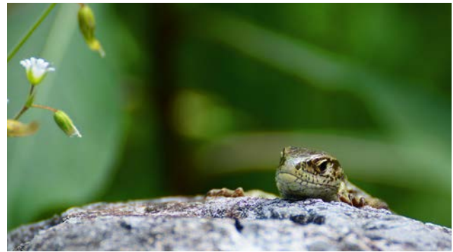
Die ausreichende Erfassung der streng geschützten Zauneidechse ( Lacerta agilis ) ist im Rahmen von Planungen wichtig.

Art, Umfang und Tiefe der Untersuchungen hängen im Einzelfall von den naturräumlichen Gegebenheiten sowie von Art und Ausgestaltung des Vorhabens ab. Ausreichend ist eine der praktischen Vernunft entsprechende Prüfung. Die gutachterliche Bestandsaufnahme muss sowohl dem individuenbezogenen Schutzansatz der Zugriffsverbote Rechnung tragen (Daten zu Häufigkeit und Verteilung der geschützten Arten sowie deren Lebensstätten) als auch eine Beurteilungsgrundlage für eine artenschutzrechtliche Ausnahmeprüfung bieten, das heißt populationsökologische Daten zur Bewertung des Erhaltungszustandes der Population enthalten.