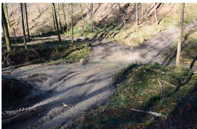
Tiefe Fahrspuren bis hin zu einer „Verbreiung“ des Bodens im Bereich einer Bachquerung, die zu dauerhaften Bodenschäden führen.

(WSL, AZ) Der Einsatz schwerer Maschinen in der Landwirtschaft führt in den Fahrspuren zu einer erheblichen Verdichtung des Bodens. Wissenschaftler unter Führung der Eidgenössischen Forschungsanstalt für Wald, Schnee und Landschaft (WSL) fanden heraus, dass die