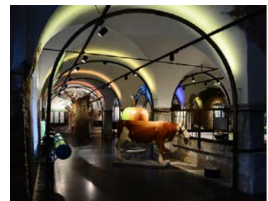
Zentraler Teil des Informationszentrums rund um den ehemaligen Futtertisch.