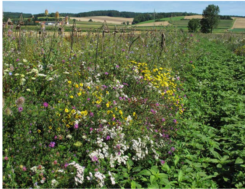
Niederbayerische Blühfläche im zweiten Jahr (angelegt 2009). Man sieht die vorjährigen Stängel von Sonnenblume und Wilder Karde und einen eindrucksvollen Blühaspekt. Im rechten Bildteil befindet sich ein über den Sommer begrünter Schwarzbrachestreifen, der bei großen Blühflächen angelegt wurde, um die Strukturvielfalt innerhalb der Fläche zu erhöhen.

Außerdem wirken Blühflächen in die sie umgebende Landschaft hinein. Insekten und Spinnentiere sind in blühflächennahen Äckern häufiger und artenreicher vertreten als in blühflächenfernen Äckern. Fasane und Feldhasen zeigen in Landschaften mit Blühflächen erhöhte Individuenzahlen als in Landschaften ohne Blühflächen. Außerdem nimmt zum Beispiel in Niederbayern mit zunehmender Anzahl an Blühflächen auch die Niederwildichte zu. Keinen Effekt haben Blühflächen auf gefährdete Insektenarten und Vögel der offenen Feldflur, wie Feldlerche ( Alauda arvensis ) und Schafstelze ( Motacilla flava ).