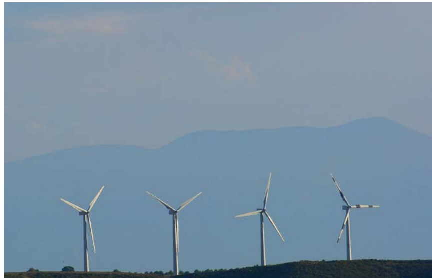
Rund um Windenergie treten zahlreiche Naturschutzfragen auf. Im BBN-Forum werden Hintergrundmaterialien zur Verfügung gestellt und aktuelle Themen diskutiert.

■ www.bbn-online.de/organisation/arbeitskreise/erneuerbare-energien-naturschutz/windenergie.html