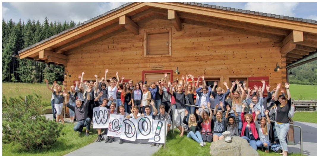
Abbildung 7 Teilnehmer aus ganz Bayern bei „We do! Vielfalt.Leben“ im Jahr 2018 in der kritischen Akademie in Inzell.

Entscheidend für die Qualität ist hierbei die intensive Zusammenarbeit mit Experten, die das Seminar in den 12 Monaten der Vorbereitung sowie bei der Durchführung unterstützt haben. Ihre Fachkompetenz ergibt zusammen mit der Kreativität und Begeisterungsfähigkeit der Schülerinnen und Schüler ein mitreißendes Programm auf hohem fachlichem Niveau. „Am Anfang hatte ich Angst, dass es schwierig wird, mit den Experten Kontakt zu knüpfen und mit diesen ein Konzept zu erarbeiten. Doch diese Angst erwies sich als