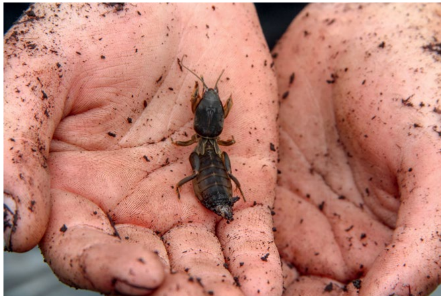
Abbildung 8 Hautnahes Erleben der Insektenvielfalt beim Workshop Moor.

Besonders wertvoll sind Untersuchungen im direkten Umfeld der Schülerinnen und Schüler. Im Workshop „Siedlung“ erkunden sie, welche Strukturen im Garten und am Haus für die Biodiversität wertvoll sind. Um dies zu verdeutlichen, drehen die Teilnehmerinnen und Teilnehmer kleine Videoclips aus der Perspektive bestimmter Tierarten. So „fliegt“ zum Beispiel die Kamera wie