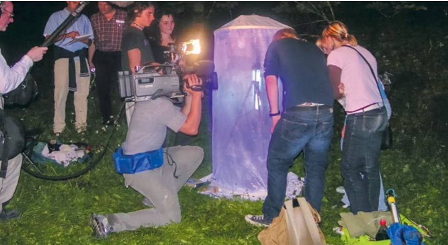
Abbildung 6 Nachtfalter-Fangaktion beim „Tag der Artenvielfalt“ am Landschulheim Marquartstein.

sen, viele davon auf der Roten Liste. Jährlich beteiligten sich bis zu 300 Kinder und Jugendliche sowie viele Lehrkräfte an den Aktionen. Die gemeinsam verfassten Dokumentationen wurden mit dem Schülerpreis und dem Forscherpreis der Zeitschrift „GEO“ belohnt und die Akteure in der Zeitschrift „GEO“ verewigt. Über diese spannende Form der Insektenuche wurde nicht nur in der Lokalpresse, sondern auch im Radio und im Fernsehen berichtet (Abbildung 6). Öffentlichkeitsarbeit ist aber nicht nur für die Schulen wichtig, sondern weckt Interesse für unscheinbare Insekten wie „Baumwanzen“ oder „Zwergschmetterlinge“ und kann durch die Förderung des Nachwuchses einen wertvollen Beitrag dazu leisten, die immer seltener werdende Artenkenntnis vor dem Aussterben zu bewahren.