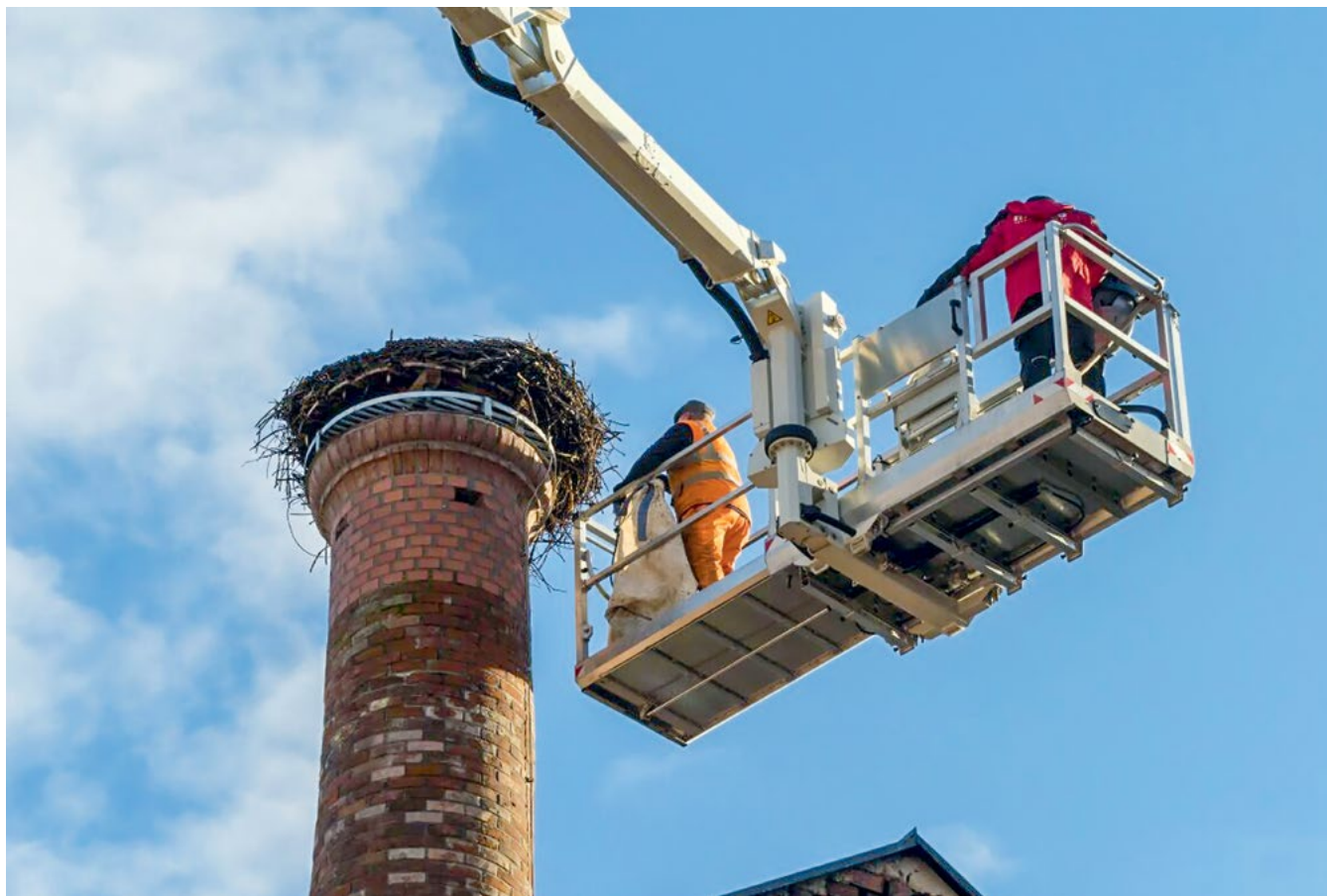
Abbildung 6 Sanierung des Storchennests in der Gustavstraße mit Hebebühne.

Stadtwaldfest, um den Bürgern die vielfältigen Maßnahmen näher zu bringen und für den Erhalt der Biodiversität zu begeistern.