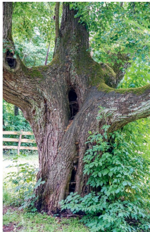
Abbildung 3 Ein Kompromiss zwischen Verkehrssicherheit und Biotopbaumschutz – Anstatt die alte, ökologisch wertvolle, aber nicht mehr verkehrssichere Gerichtslinde im Wittelsbacher Park zu fällen, wurde sie zum Schutz der Parkbesucher umzäunt.