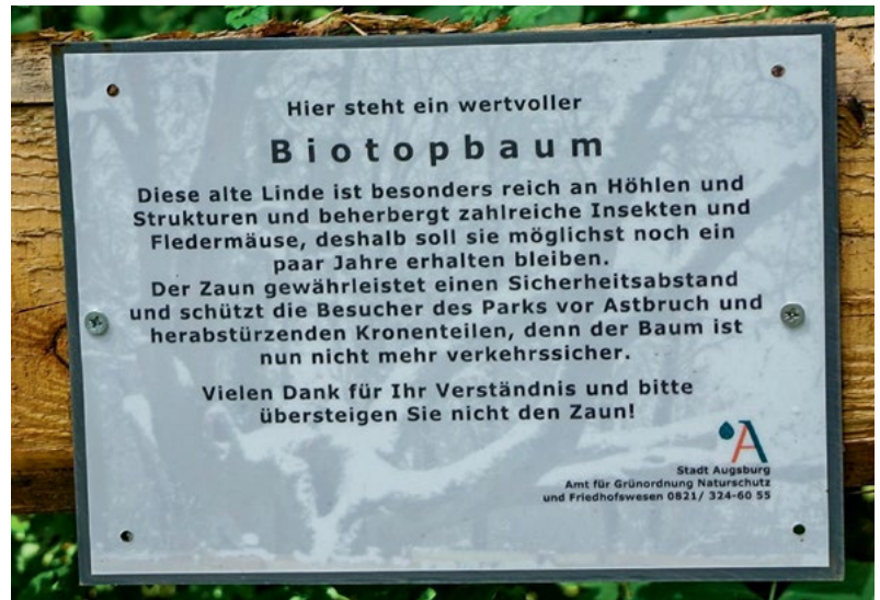
Abbildung 2 Hinweisschild der Stadt Augsburg an der Umzäunung der alten Gerichtslinde.

Bei der Umsetzung der gesetzten Ziele traten allerdings auch Probleme auf. So fehlt es zum Teil an grundlegenden Informationen über die Ökologie der Zielarten. Im Fall des Mauer-Ahlenläufers ist die Stadt Augsburg gezwungen, zum Erhalt der Art im Rahmen von Mauersanierungen zu experimentieren.