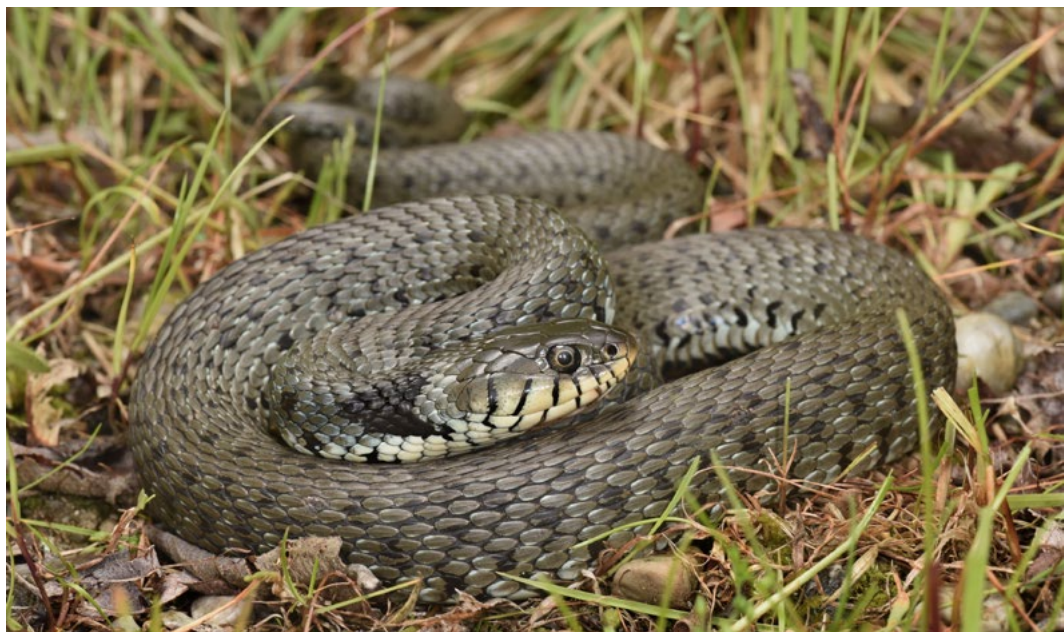
Abbildung 3 Die Barrenringelnatter ( Natrix helvetica ) ist seit 2018 in Bayern sicher nachgewiesen. Sie ähnelt sehr der Ringelnatter ( Natrix natrix ) – es fehlen jedoch der gelbe Halbmond auf dem Nacken und die großen schwarzen Flecken am Kopf, die schwarze Nackenzeichnung ist dagegen meist vergrößert.

Ein Vergleich der Roten Liste 2019 mit der vorausgehenden Ausgabe von BEUTLER & RUDOLPH (2003b) ergibt bei vier Arten veränderte Einstufungen.