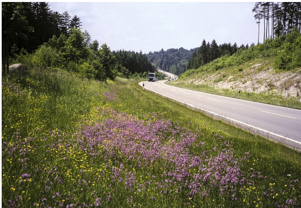
Abbildung 3 Magergrünland und Rohbodenstandorte im Extensivbereich einer Straße mit Anschluss an Gehölzbestände und Wälder, wie hier an einer Bundesstraße, eignen sich besonders gut als Auswahlflächen.

Das Konzept wird unter Berücksichtigung der zur Verfügung stehenden Personal- und Finanzausstattung sukzessive ab dem Jahr 2020 umgesetzt. Der erste Schritt ist die Schulung des Betriebsdienstpersonals zur Umstellung der Pflege im Normalbereich. Parallel werden im Jahr 2020 die Auswahlflächen identifiziert. Hierfür wurden von den 19 Staatlichen Bauämtern mit Straßenbauaufgaben die Planungsleistungen an Landschaftsplanungsbüros vergeben. Das StMB hat für die Flächenauswahl ein bayernweit einheitliches Vorgehen erarbeitet, um die Auswahlflächen festzulegen. Für die von der Staatsbauverwaltung (in Abstimmung mit den Fachbehörden des Naturschutzes) festgelegten Auswahlflächen werden dann von den Fachbüros die Pflegekonzepte erarbeitet. Ziel ist es, so schnell wie möglich auf die optimierte Pflege umzustellen. Ab 2021 sollen die ersten spezifischen Pflegemaßnahmen durch externe Dienstleister (zum Beispiel Landschaftspflegeverbände, Fachfirmen oder Maschinenringe) umgesetzt werden.