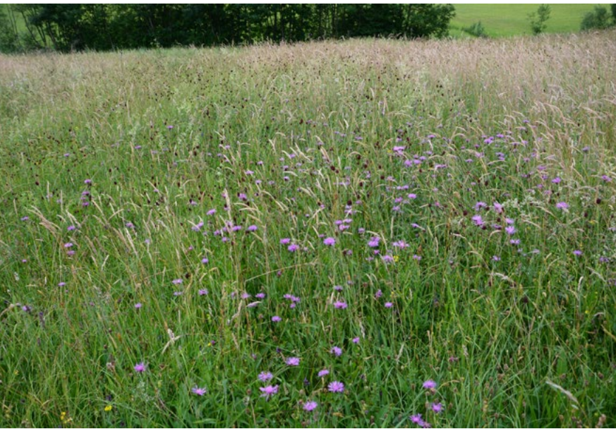
Abbildung 2 Flachland-Mähwiese im Landkreis Gar- misch-Partenkirchen (Foto: Andreas Zehm/Piclease).