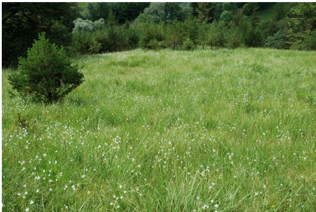
Abbildung 3 Pfeifengraswiese im Landkreis Garmisch- Partenkirchen (Foto: Andreas Zehm/ Piclease).

Oberböden beeinträchtigt (BLUM 2019; MULNV NRW 2011). Der erhöhte Niederschlag in Herbst und Winter wäscht außerdem verstärkt nicht genutzte Düngernährstoffe aus. So steigt das Risiko, dass auch vermehrt Nitrat und Phosphor in das Grundwasser ausgewaschen werden, wodurch sich die Trinkwasserqualität verschlechtern kann. Durch die erhöhten Herbst- und Winterniederschläge sowie auch durch Starkregenereignisse steigt zudem die Gefahr von periodisch zunehmender Bodenvernässung und Überflutungen an. Diese Prozesse sind besonders bei den natürlicherweise bereits trockenen bis mittelfeuchten Böden ausgeprägt, welche beispielsweise mit Flachland-Mähwiesen bestanden sind (siehe Tabelle; BERAUER et al. 2019).