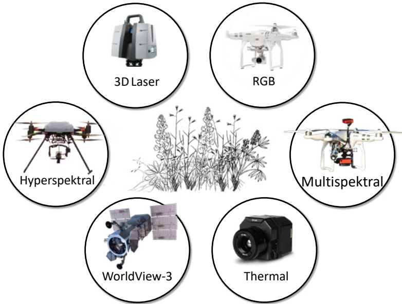
Abbildung 2 Übersicht der eingesetzten Sensor- und Plattformsysteme.

für ein gezieltes Lupine-Management zu werden. Zum anderen bietet er die Möglichkeit, die zeitliche Veränderung der Lupine-Abundanz zu dokumentieren, um somit zukünftige Managementszenarien und Prognosemodelle zu unterstützen. Vor diesem Hintergrund führten Mitarbeitende des Fachgebietes „Grünlandwissenschaft und Nachwachsende Rohstoffe“ der Agrarfakultät der Universität Kassel von 2016 bis 2020 umfangreiche Sensormessungen durch.