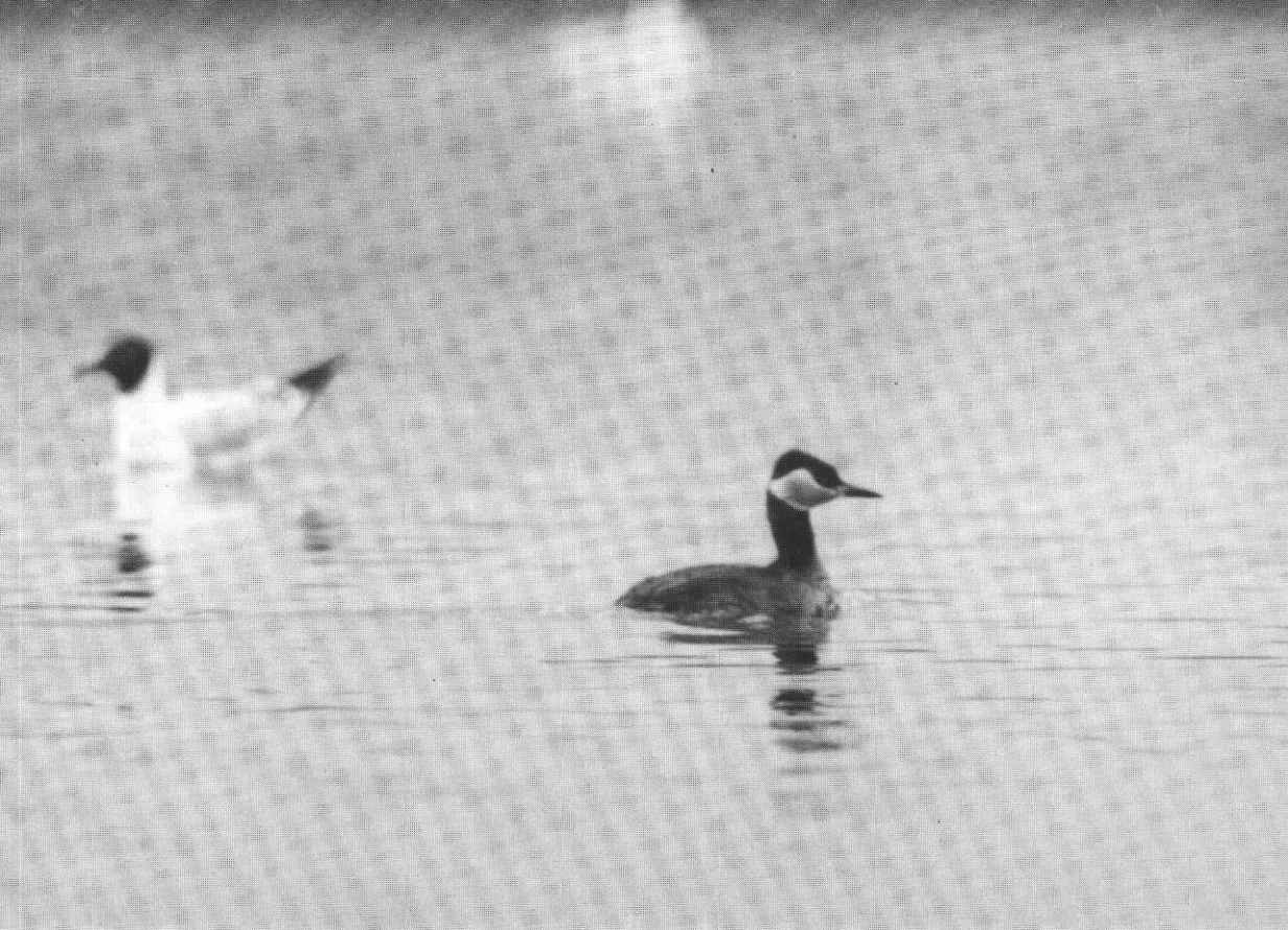
Rothalstaucher vom 20.4., Rieselfelder Münster.

Schnatterente: 1,0 am 1.3. sowie 1,1 am 6.3. Hengsteysee (B.K., F.M.), 6,6 am 18.3. Filterbecken bei Witten (H. u. M.Sell), 2,1 vom 18.3.–6.4. Do-Dorstfeld (F.M., R.N.), 6,4 am 22.3. Echthausen, Letztbeobachtung dort am 27.4. 1,1 (B.K.), in den Rieselfeldern MS Feststellungen von 1,1 fast regelmäßig bis Juni (M.Sp. u.a.); Halterner Stausee 31.3.–13.5. unregelmäßig 1–6 Ex. (G. Streibel).