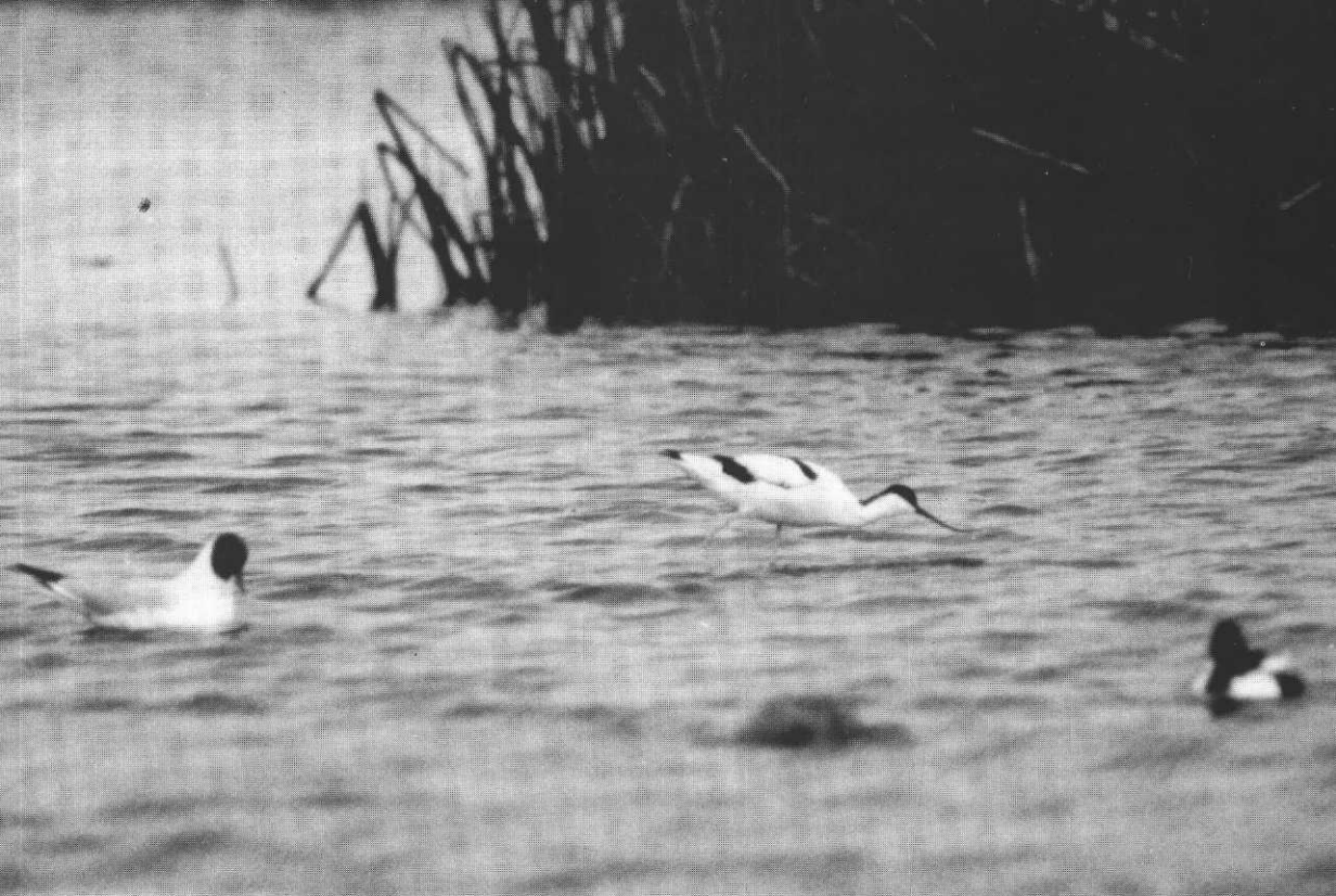
Säbelschnäbler vom Mai aus den Rieselfeldern Münster.

Alpenstrandläufer: Erste Frühjahrsbeobachtung am 6.3. 1 am Mittellandkanal bei Hille (G.Zg.), in den Rieselfeldern MS max. 16 am 3.4. (M.D., M.Ha.).