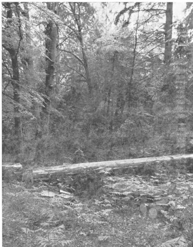
A b b. 1: Zwergschnäpper Biotop (Revier I) im NSG Donoper Teich

Baumschicht: Picea excelsa 4 (div. Altersklassen bis ca. 120j.), Fagus silvatica + (auch in der Strauchschicht), Quercus robur +, Betula spec. + (Ruinen).