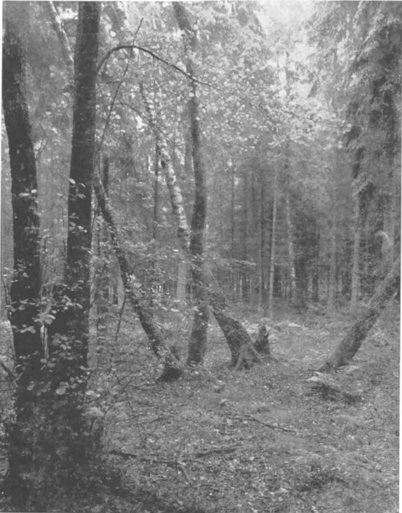
A b b. 2: Lichtung im Revier II (Sternschanze)

Bodenschicht: Sphagnum spec. , Leucobryum glaucum .