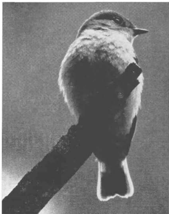
Abb. 3: Zwergschnäpper, einjähriges ♂; NSG Donoper Teich, 1. Juni 1968.

Beide im Frühjahr 1968 beobachteten ♂♂ durchstreiften ständig ihr Revier und setzten sich vorzugsweise auf Zacken und Astenden der Dürzweigezone (Abb. 3), um von dort aus zu singen oder Insekten zu fangen. Beide