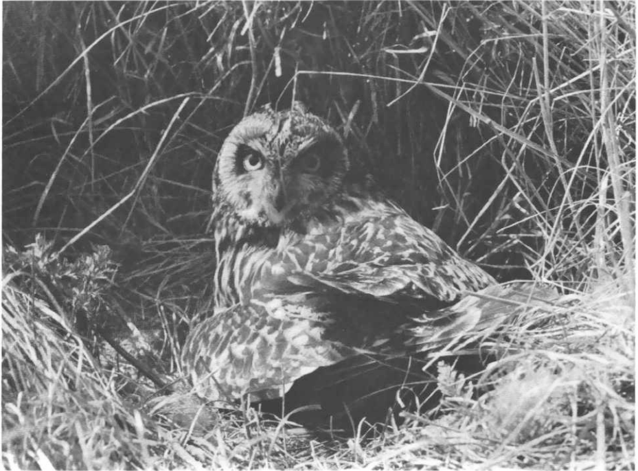
Sumpfohreule am Nest im Gildehauser Venn.

Anschrift des Verfassers: 495 Minden, Ulmenstr. 3