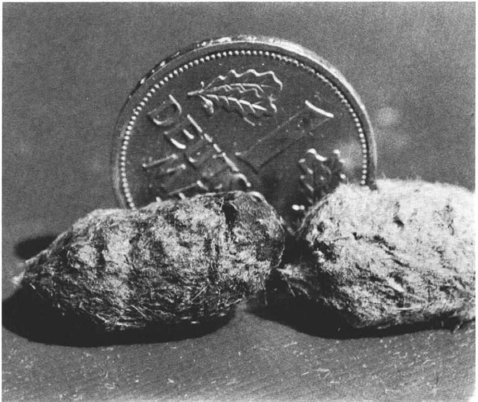
Abb.: Raubwürgergewölle – zum Größenvergleich ein Geldstück im Hintergrund

Diagramm: Prozentuale Zusammensetzung der Raubwürgergewölle nach Beutetieren, dargestellt im Kreisdiagramm (F=Feldmaus, W=Waldmaus, Wsp=Waldspitzmaus, I=Insekten (Mistkäfer)).