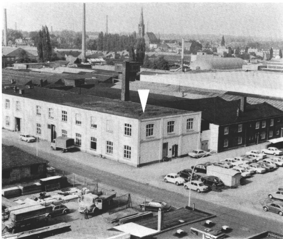
Das Dreieck kennzeichnet jene Stelle, an der die Jungkiebitze angetroffen wurden. Ein sehr ungewöhnlicher Brutplatz für diese Art.

Kiebitzbrut auf einem 7 m hohen Flachdach. — Am 21.6.72 sah ich in Bocholt auf der Industriestraße, etwa 500 m von den Bocholter Aawiesen entfernt, einen Kiebitz aufgeregt rufend auf und abfliegen. Zuerst vermutete ich, daß einige Kiebitzjunge sich verirrt hätten und der Altvogel nun versuchte, seine Jungen zwischen den Parkplätzen und Industriebetrieben, die an dieser Stelle sind, zurück zu den Aawiesen zu führen. Als ich den Kiebitz einige Zeit beobachtet hatte, war ich nicht wenig erstaunt, als ich sah, wie er auf dem 7 m hohen Flachdach der Maschinenfabrik Spalek landete. Auf dem schnellsten Weg setzte ich mich mit der Firmenleitung in Verbindung, die mir gestattete, das Dach zu besteigen. Als ich auf dem Dach angelangt war, sah ich, daß das Flachdach auf