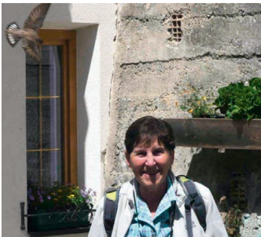
Abb. 1. Felsenschwalbe Ptyonoprogne rupestris attackiert Beobachterin. – Observer attacked by European Crag Martin Ptyonoprogne rupestris . Planeil, Südtirol, 17. Juni 2018.