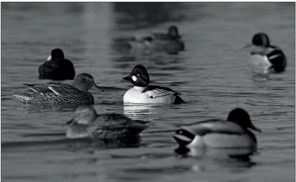
Abb. 2: Paarbindung zwischen einem Schellenten-♂ und einem Stockenten-♀. 28.2.2015. Seeburg (MSH).

Fig. 2: Pair bond between Common Goldeneye-♂ and a Mallard-♀. 28st February 2015. Seeburg (MSH).