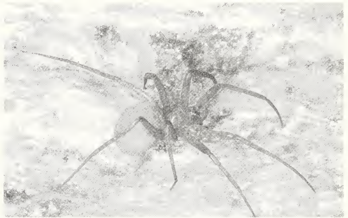
Abb. 1: Zimiris doriai Simon, 1882, eingeschlepptes Weibchen, Köln. Beachte die nach vorne verlagerten lateralen vorderen Spinnwarzen und die drei hell scheinenden Nebenaugen.

Verbreitung: Nach PLATNICK & PENNEY (2004) ist die Art in Indien, Indonesien (Java), Malaysia, Elfenbeinküste, Sudan, Jemen, Eritrea, Französisch-Guyana, Kuba, Mexiko und in der Dominikanischen Republik verbreitet. Der Container, aus dem die eingeschleppten Tiere stammen, kam aus Vietnam, d.h. er war dort beladen worden. Es ist